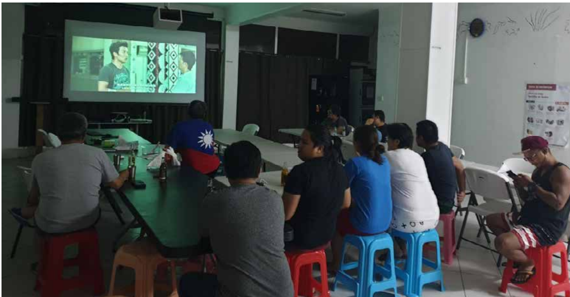
海外工程公司（OECC）聖露西亞分公司員工一同欣賞臺灣影展的影片「只有大海知道」。