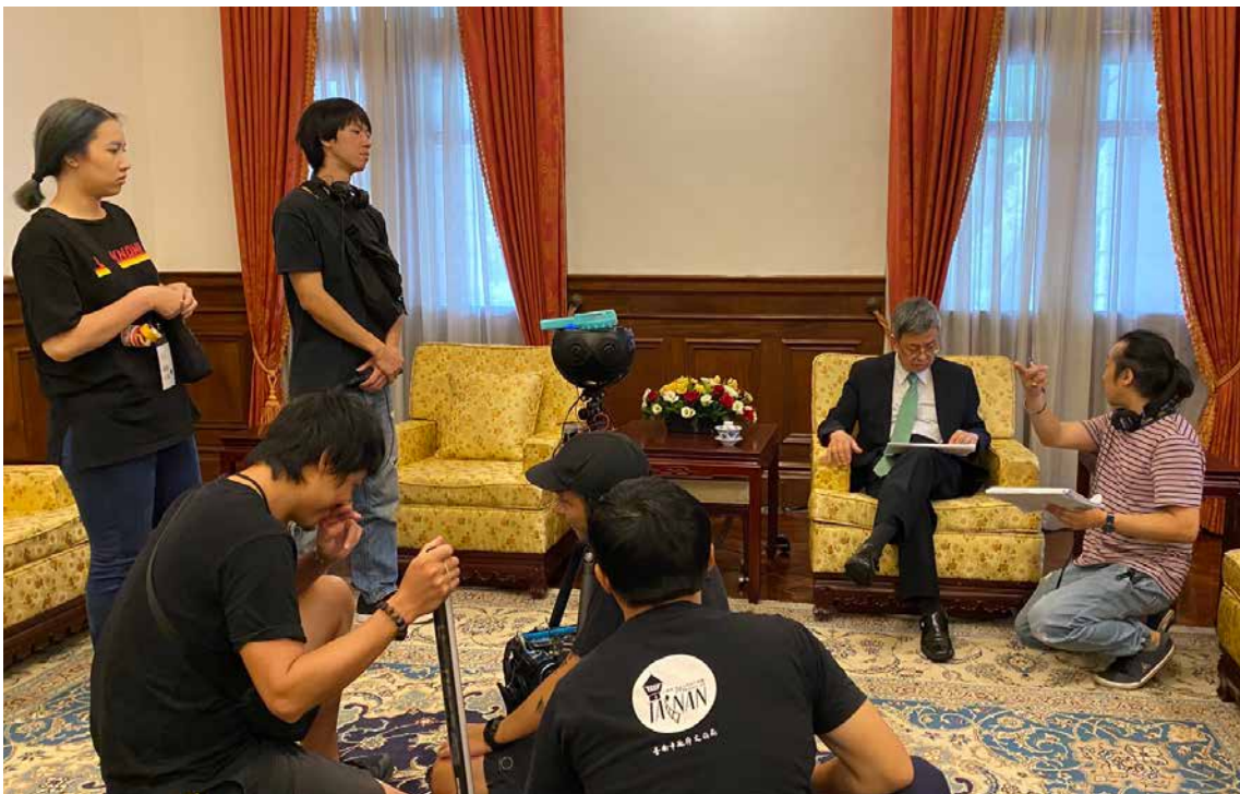
■ 「關鍵三布局」VR導演與陳前副總統建仁溝通拍攝細節。

為了將臺灣的防疫歷程呈現給更多觀眾，國傳司除拍攝VR影片外，也製作傳統4K影片，然而兩種截然不同的拍攝需求，也為本案帶來許多挑戰。