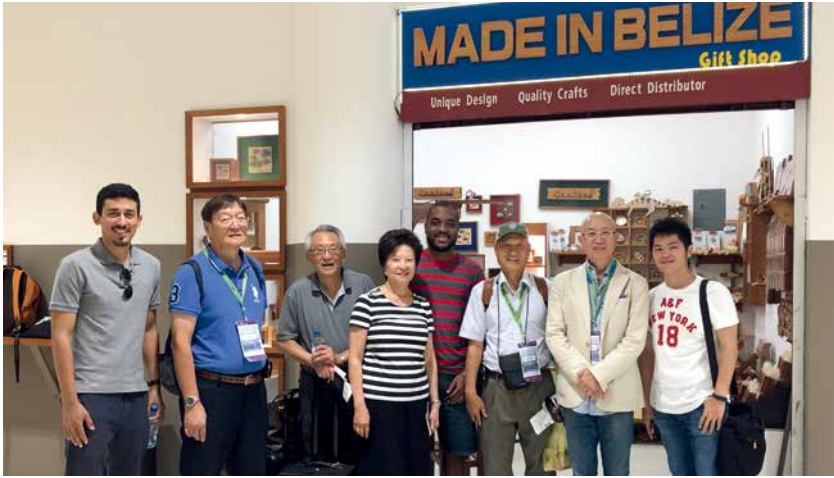
■ 2019年10月駐貝里斯大使館籌組的臺商來貝農業投資考察團。