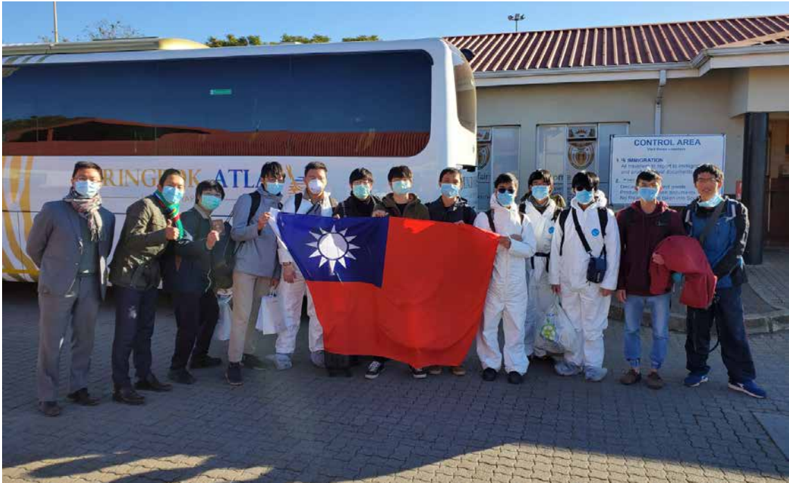
史瓦帝尼役男搭車抵南非邊境換乘巴士前往約翰尼斯堡搭機返臺。

並加強役男返臺班機隔離措施及入境檢疫規格，終於讓役男順利返臺治療，成為本屆外交替代役中第1位返臺的役男。所幸後來經診斷他是感染「黴漿菌肺炎」，不是武漢肺炎，實在是驚無險。