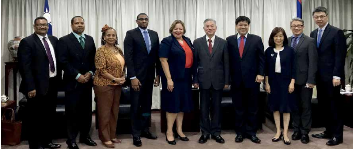
貝里斯投資貿易部國務部長潘崔西（Hon. Tracy Taegar-Panton）拜會時任經濟部部長沈榮津。

涉後，該兩國終於不再堅持反對降稅清單中的21項商品，而僅針對某一商品代碼下的單一項目提出保留。