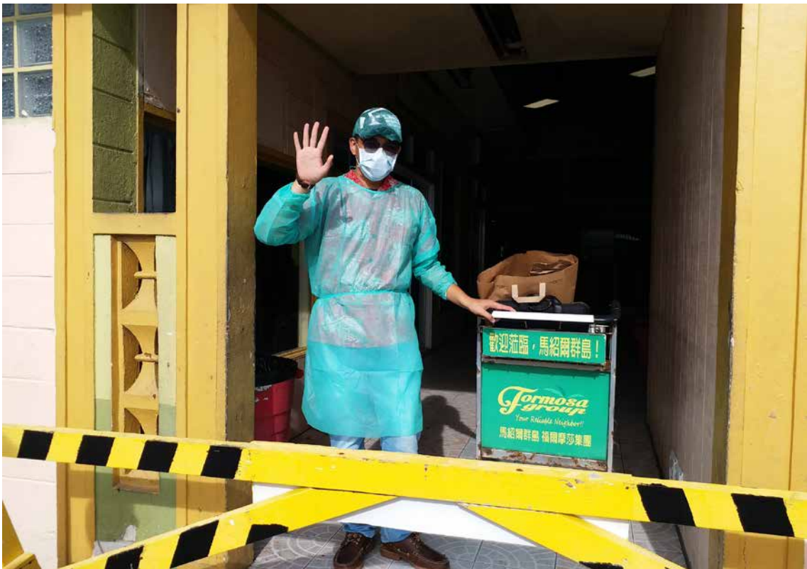
■ 馬紹爾群島役男於機場check in 後即不能離開限制活動範圍。

這段期間，一位派駐南太平洋的陳姓役男，持續發燒不退，出現肺炎徵狀，數次前往當地醫院看診不癒，然因為醫療設備有限，診斷不出病因又無法做COVID-19病毒核酸（PCR）檢測。在當地國際航班全部中斷之下，外館經過一番努力，安排役男搭乘日本學生返國包機先赴東京再轉返臺灣。因為當時我國疫情指揮中心仍有疑慮，遲未同意該名役男返國。就在赴日包機起飛前一天，本部同仁擔心疫情指揮中心再不予放行的話，該役男回臺機會恐十分渺茫，萬一病情惡化勢將造成遺憾，因此再度努力斡旋，疫情指揮中心最後才同意以快篩取代PCR檢測，