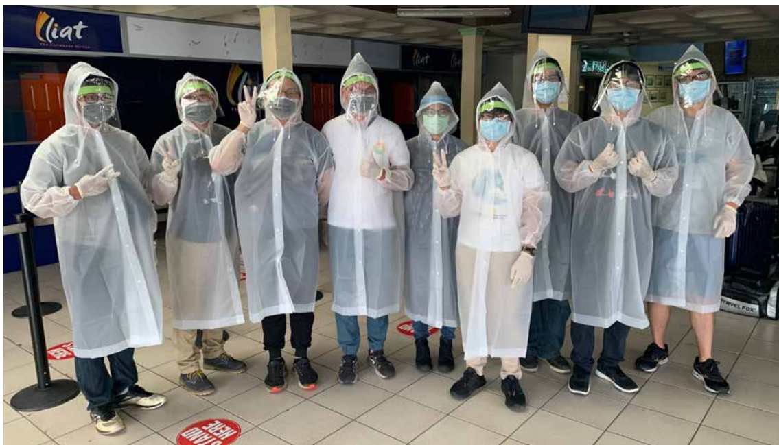
■ 聖露西亞外交替代役男踏上歸途。

最後也最為重要的是，這次海外替代役男能夠平安返國退役，絕對不是單一機構或承辦人的功勞，而是政府各單位不分國內外集思廣益、通力合作，共同完成此一艱鉅的任務。這些役男們也許不知道他們回家的路上有多少人伸出援手，包括外交部各級長官的信任與授權、國合會的密切配合、外館同仁的積極任事，以及疫情指揮中心、疾管署、役政署、海巡署、海關及外交部各單位的協助等，筆者想在此真心表示感謝。謝謝所有人的努力及辛勞，為役男們鋪出這條返鄉路。■