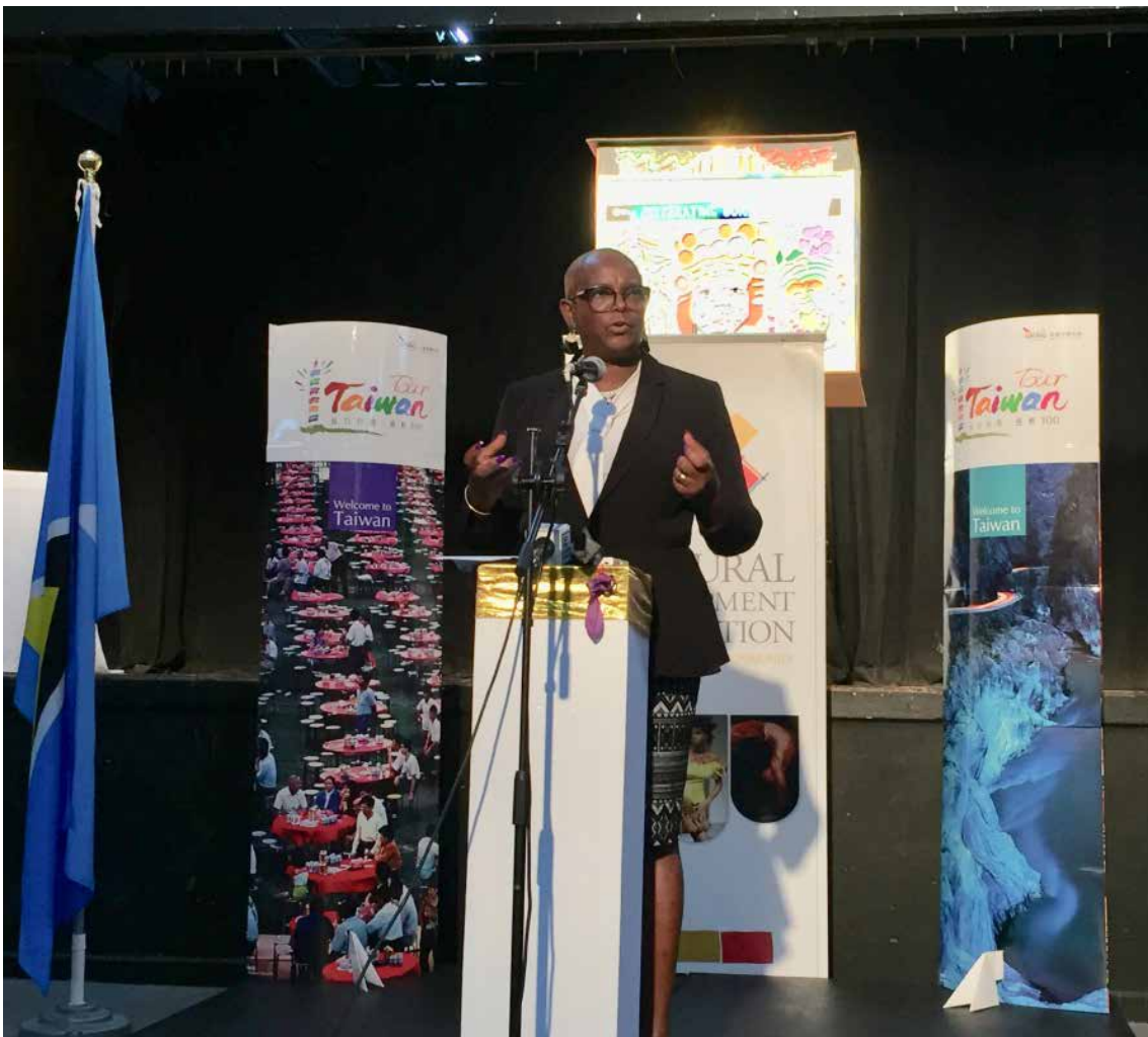
露國貝爾羅絲文化部長在花燈比賽頒獎典禮致詞。