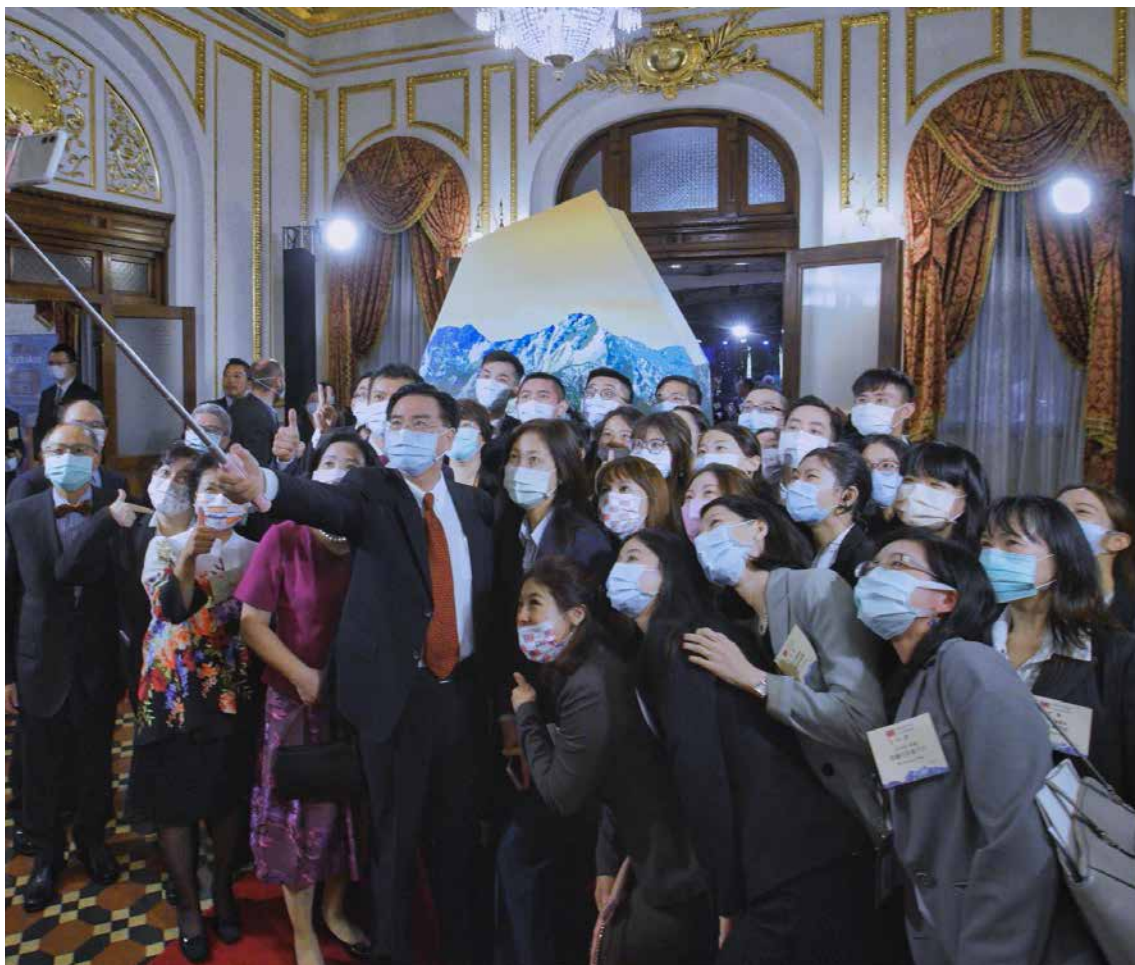
■ 吳部長暨夫人偕外交部長官們與禮賓處同仁自拍合影留念。

外國媒體朋友等逾300位貴賓的祝福下，一場滿載著來自臺灣各方年輕人夢想與國際友誼的盛會圓滿落幕。對臺灣而言，2020年雖然是艱難的一年，卻也是我們在國際舞台上閃耀的一年。今年的國慶，我們一如往常在充滿歷史風華的臺北賓館，與各國友人共同慶祝臺灣豐饒的文化、引以為傲的自由民主，也一同見證這一年來臺灣人締造出不可思議的防疫奇蹟。■