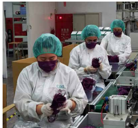
「攜手台灣」電視特輯節目拍攝「口罩國家隊」。

「攜手台灣（Embracing Taiwan）」電視特輯是目前唯一在不同國家以相同名