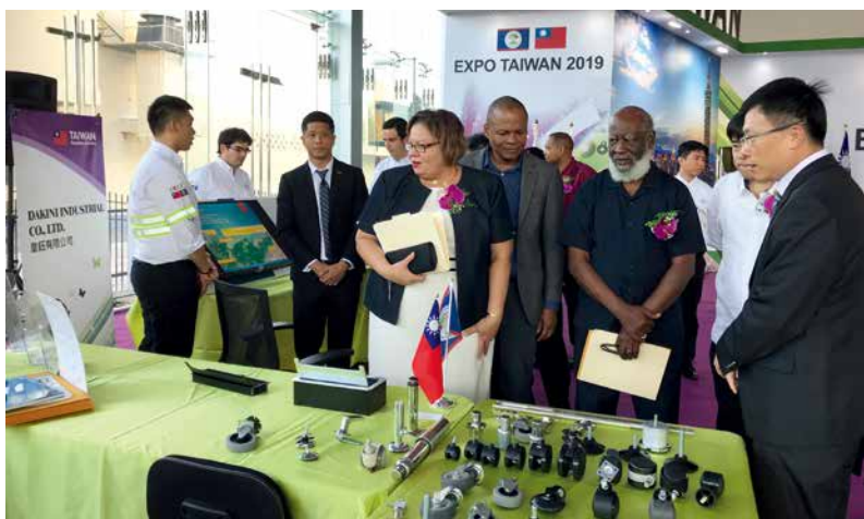
■ 2019年在貝里斯舉辦之「中華民國商展」。

另外，貝國投貿部也一度進洽本館，請我方折衷妥協，同意上述兩國提出的保留意見，盼加速簽署流程。然而臺貝ECA約本是雙方談判獲致的共識，我方必須維護自身國家利益，本館因此建議貝方續與上述兩國政府交涉，並將經貿議題提升至外交層次。在貝方高層親自出面交