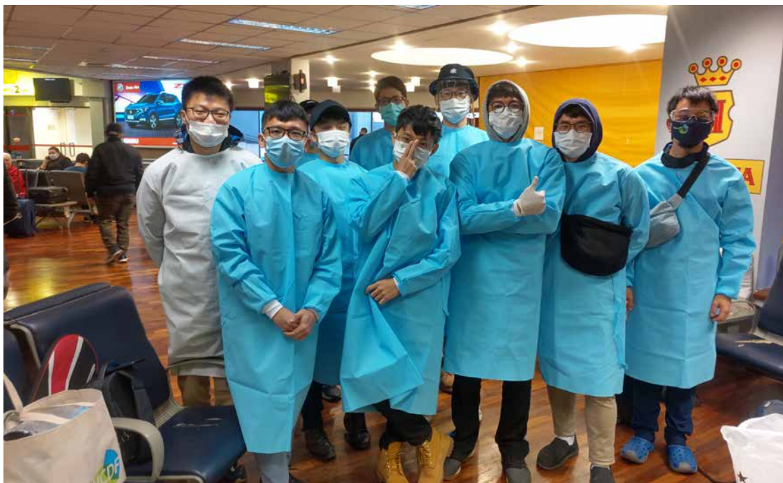
巴拉圭技術團役男們於亞松森機場搭機返臺前合影。

無期。有役男因為等不及，直接寫信給部長信箱求助，結果外交部還沒來得及回這封電郵，我國的大使館就洽獲駐在國政府同意放飛包機，役男們也歡天喜地登機返國。