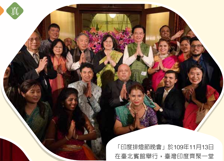
「印度排燈節晚會」於109年11月13日在臺北賓館舉行，臺灣印度齊聚一堂共賀排燈節。