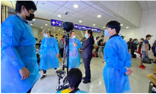
「關鍵三布局」VR工作人員穿著隔離衣在桃園國際機場拍攝旅客入境檢疫過程。

為了達到「產官學民各界防疫全紀錄」，拍攝團隊走訪多處勘景，包括負壓隔離病房、口罩工廠、臺北捷運、桃園機場、寧夏夜市、疫苗研發中心及中研院基因體中心等。因大多受訪團隊與專家學者皆忙於防疫，在國傳司積極協調下，終於讓拍攝對象及拍攝場景逐一定案。義大利籍的4K版紀錄片導演陳璽文說到：「這支影片最難拍攝的部分就是桃園機場的檢疫場景」，為了忠實記錄入境旅客檢疫過程，攝影團隊和機場協調近一個月。VR版的導演賴冠源則對於拍攝過程中的防疫措施，感到印象深刻，例如：所有人都必須穿戴隔離衣進行拍攝工作。