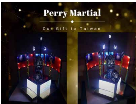
■ 花燈比賽得獎作品「給臺灣的禮物」(Our Gift to Taiwan)。