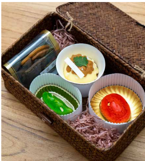
■ 「菓實日」特色甜品—法式紅龜粿、人之島、滷肉飯慕斯蛋糕及臺灣特有種動物餅乾。