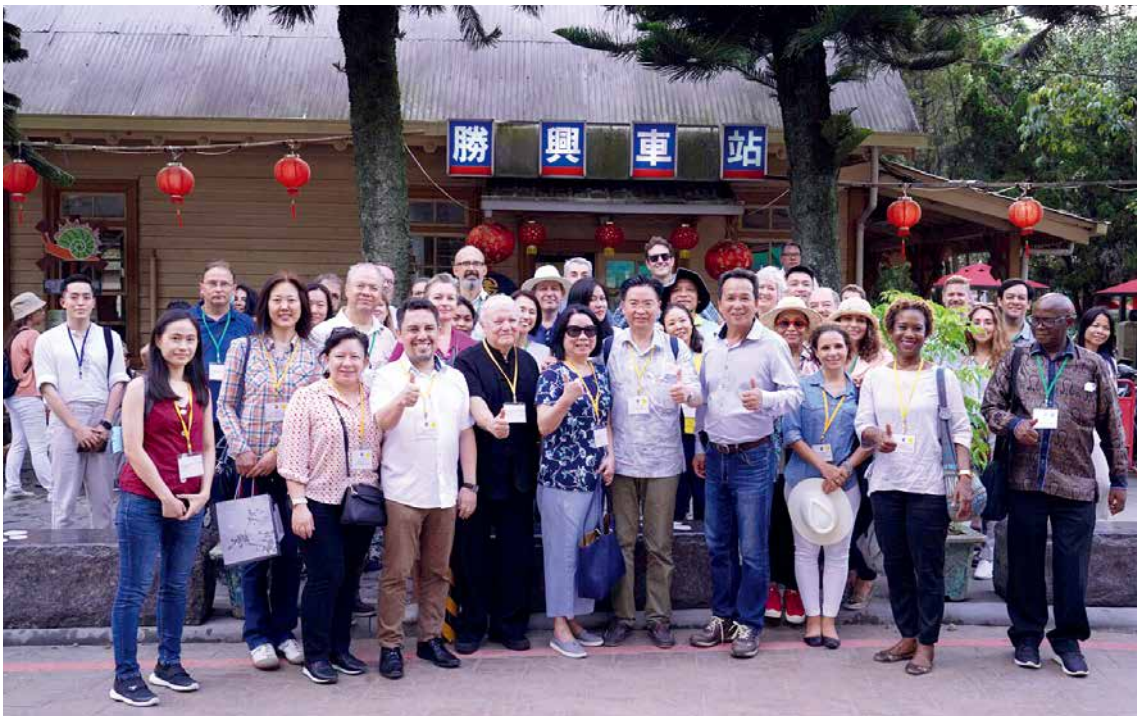
■ 臺灣西部縱貫鐵路海拔最高的勝興車站，使節團到此一遊！

臺三線，又名內山公路，從臺北蜿蜒至屏東，總長四百多公里，其中「臺三線浪漫大道」從桃園大溪至臺中新社路段，途經數個客家聚落，這些聚落因為層層山岳阻隔，各自保有獨特原始風味的原鄉客家文化與農村田園景緻。