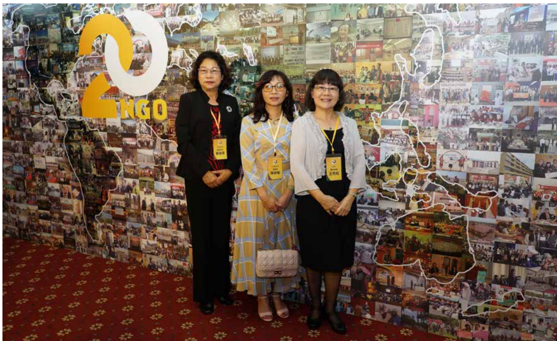
■ NGO代表們紛紛於20週年大照片牆前合影留念。

外交部在當年10月2日正式揭牌成立「非政府組織國際事務委員會」，將原本屬於國際組織司有關非政府組織的業務劃歸該會辦理，希望藉由民間力量推動全民外交，提升臺灣在國際社會的能見度；後來在2012年配合政府組織改造，更名為「非政府組織國際事務會」，簡稱NGO國際事務會，主要任務包括：協助國內NGO進行國際參與、輔導國內NGO從事國際合作、建構國內NGO參與國際事務能力以及提供NGO國際參與交流與聯繫平台。