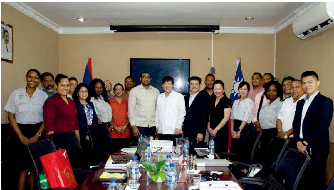
■ 臺貝就簽署「部分範圍協定」進行初步協商討論。

貝里斯的出口主要往CARICOM域內國家，以及英國、美國及墨西哥。貝國因缺乏基礎工業，機械及化學產品均仰賴進口，導致長期貿易逆差，亟欲拓展出口市場，並於2014年主動向我國表達洽簽經貿協定的意願。當時客觀環境尚未成熟，雙邊協定沒能順利開花結果。隨著近年我國與邦交國持續強化經貿合作，臺貝之間也出現洽簽經貿協定的契機。