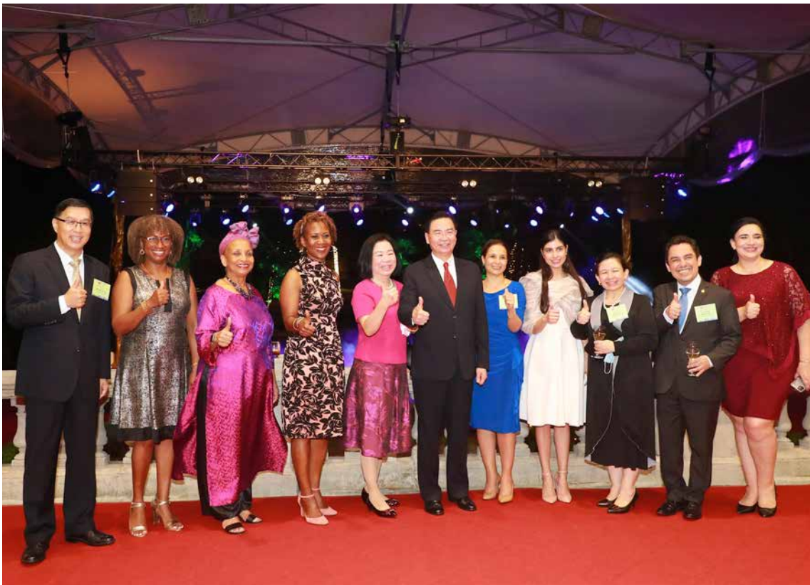
吳部長暨夫人（左六、左五）及曹常務次長（左一）與駐臺使節合影留念。

在全體國人的共同努力之下，臺灣成為全球少數未在武漢肺炎防疫期間封城、停班或停課的國家。也因此，外交部能夠如往年一般，在雙十國慶當天舉辦國慶酒會。而今年的酒會除了慶祝中華民國（臺灣）109歲的生日之外，更是臺灣與理念相近國家共同歡慶民主自由等普世價值的