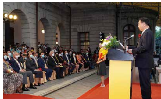
■ NGO代表、駐臺使節及政府官員逾300人出席茶會。

10月中旬初秋微涼的季節，氣候不甚穩定，所幸老天爺十分幫忙，讓茶會當天是個出大太陽的暖和好天氣。傍晚舉行的活動，除了佈展的NGO中午左右抵達，許多賓客也迫不及待提早在下午4點陸續報到，參觀展覽，交流互動。而為了防範武漢肺炎（COVID-19）疫情，工作