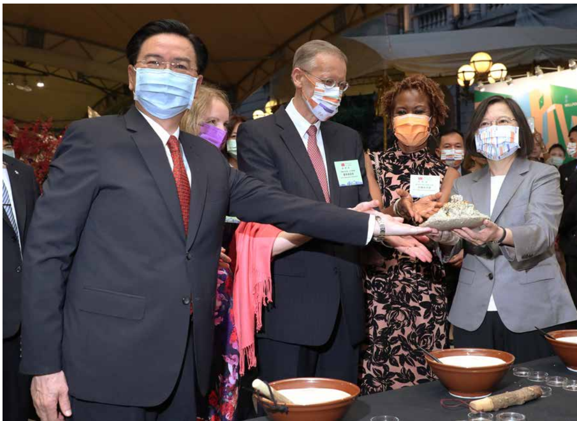
■ 蔡總統與吳部長同聖克里斯多福及尼維斯大使哈菁絲及美國在台協會處長鄺英傑合力完成「客家黃金擂茶雪花冰」。

N-Ice Taipei的老闆林煒鈞來自屏東，曾擔任調酒師，因為對夢想的追求與堅持，在臺北開了一家充滿質感的剉冰店。林煒鈞感性地跟大家分享：蔡總統在國慶演說引用創作歌手謝銘佑的歌詞：「有路，咱沿路唱歌；無路，咱躑躅過嶺」，讓他想起創業這些年無論逆境或順