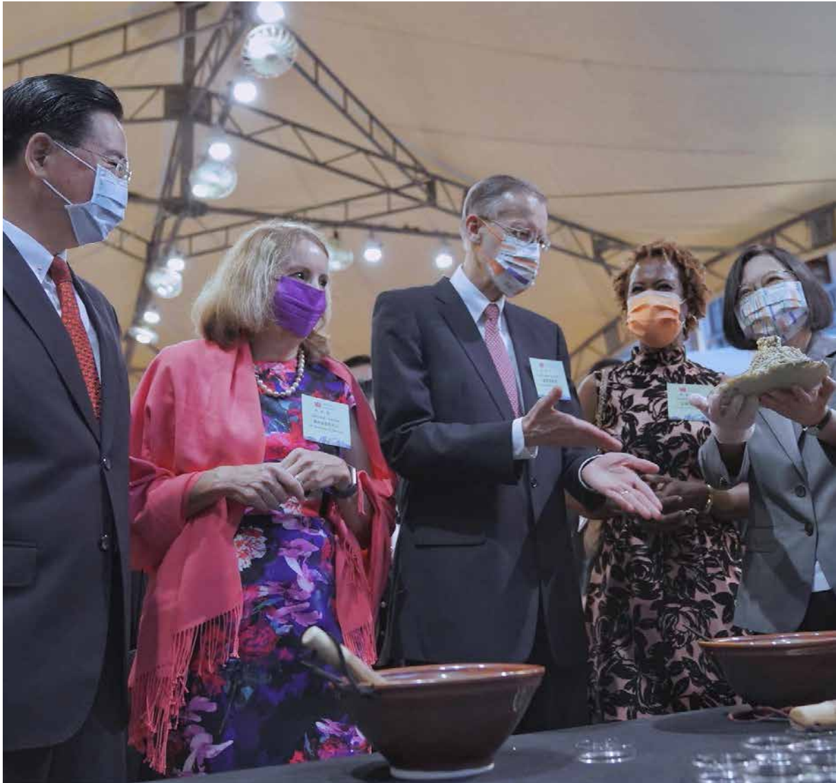
■ 在國慶酒會上，蔡總統與吳部長同聖克里斯多福及尼維斯大使哈菁絲及美國在台協會處長鄺英傑合力完成「客家黃金擂茶雪花冰」。