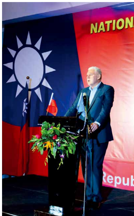
■ 查士納總理代表露國政府在我國國慶酒會致詞。

陳家彥大使致詞時，感謝查總理在今年聯合國大會期間以強而有力且堅定的語調支持臺灣參與聯合國體系。陳大使特別引用查士納總理在今年聯合國大會的發言，強調「近達2,400萬人口的國家不應被排除在國際社會之外」，並回顧過去一年我國防疫及經濟發展的各項成就，包括未曾實施封城及停課等措施仍維持低確診案例以及向有需要的國家捐贈防疫物資等，彰顯蔡總統「臺灣可以幫忙，而且正在幫忙」的宣示。