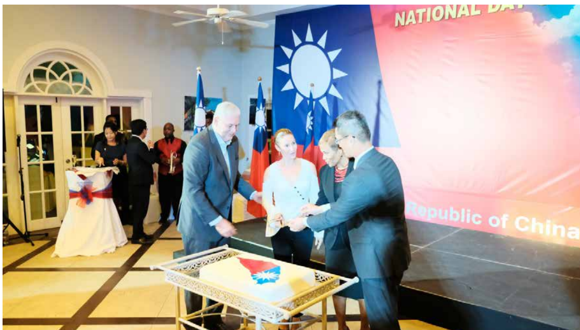
■ 陳大使、露國查總理伉儷及麥晶泰參議長共同切國慶生日蛋糕。

績。總理請陳大使代向蔡總統及外交部吳部長致上最高謝意，更承諾將繼續在國際場域支持臺灣，呼籲包括聯合國（UN）在內等國際組織納入臺灣，充分展現露國力挺臺灣以及臺露的友好情誼。