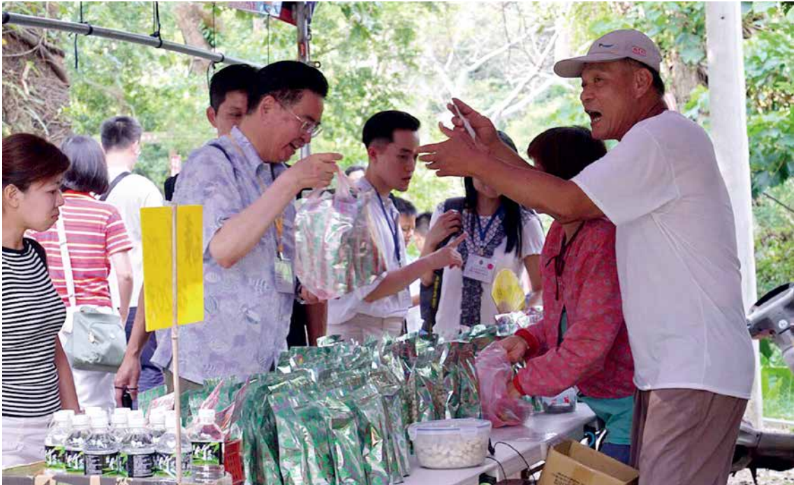
吳部長在龍騰斷橋以行動響應振興國旅。

利用閒置軌道，參考挪威、德國及韓國的案例，以公私協力模式興建Railbike鐵道自行車，讓旅客能以低碳、環保且安全的方式體驗昔日運送樟木的舊山線鐵道，飽覽沿途景觀。