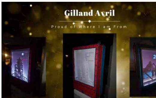
■ 花燈比賽得獎作品「我為我的出身感到驕傲」(Proud of Where I am from)。