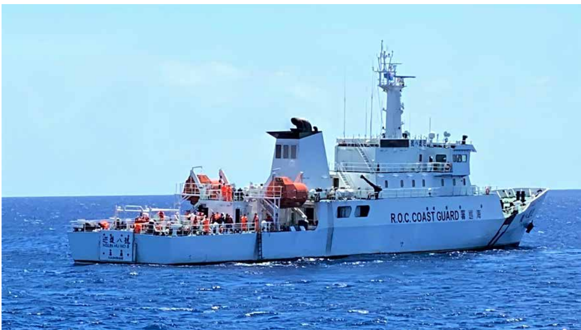
前往吐瓦魯接載役男之海巡署巡邏八號返航途中。

筆者回首半年多來公文往返、絞盡腦汁，不斷協調及安排，終於能夠在疫情蔓延全球之際，將88位派駐全球15個國家的役男平安健康地送回臺灣，順利退役，過程真是備極艱辛。幸好結果圓滿，也是