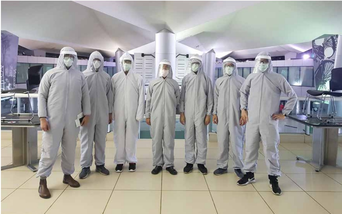
瓜地馬拉役男啓程返臺。