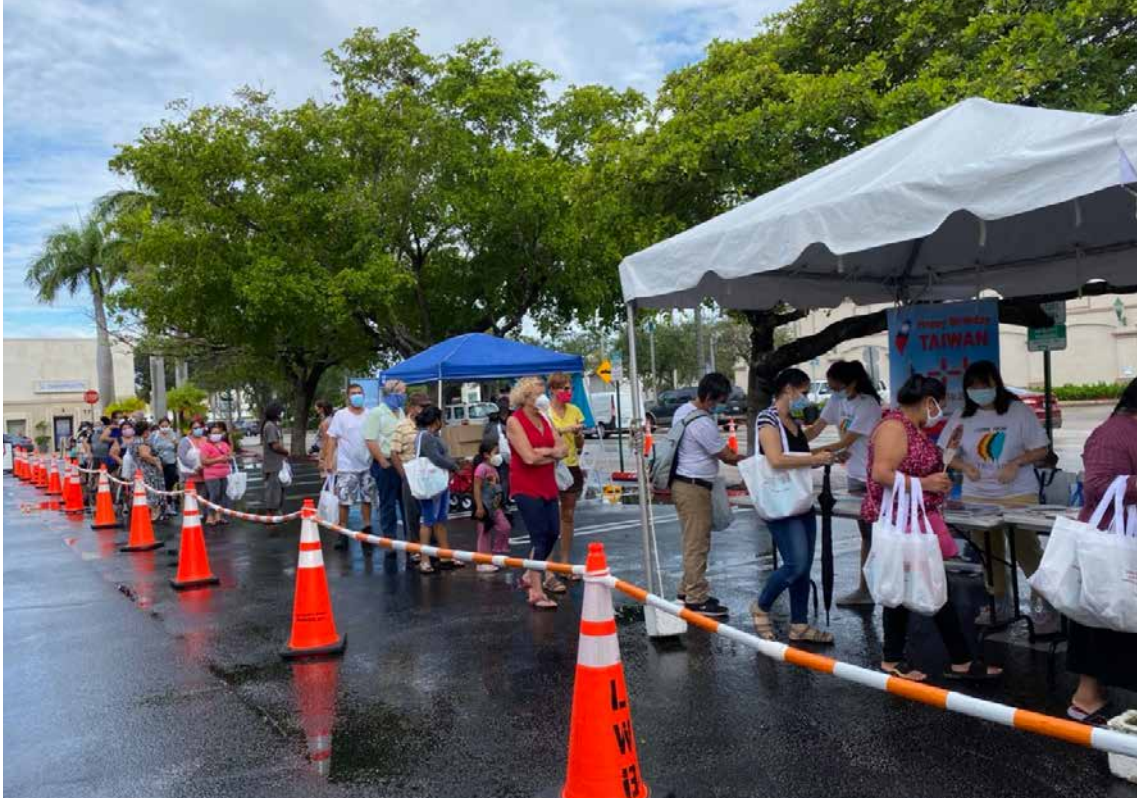
等待發送食物的民眾大排長龍。