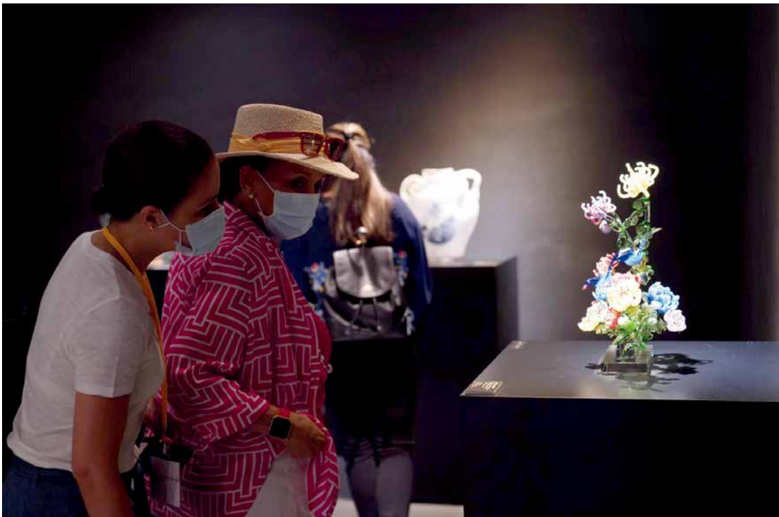
■ 大使們欣賞玻璃工藝博物館藝術品。