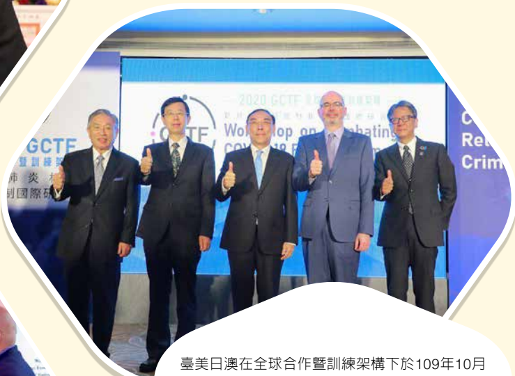
臺美日澳在全球合作暨訓練架構下於109年10月28日共同舉辦「新冠肺炎相關犯罪防制國際研習營」。法務部部長蔡清祥（左三）、外交部政務次長田中光（左一）、法務部調查局局長呂文忠（左二）、AIT/T副處長谷立言（右二）與日本台灣交流協會副代表橫地晃（右一）合影。