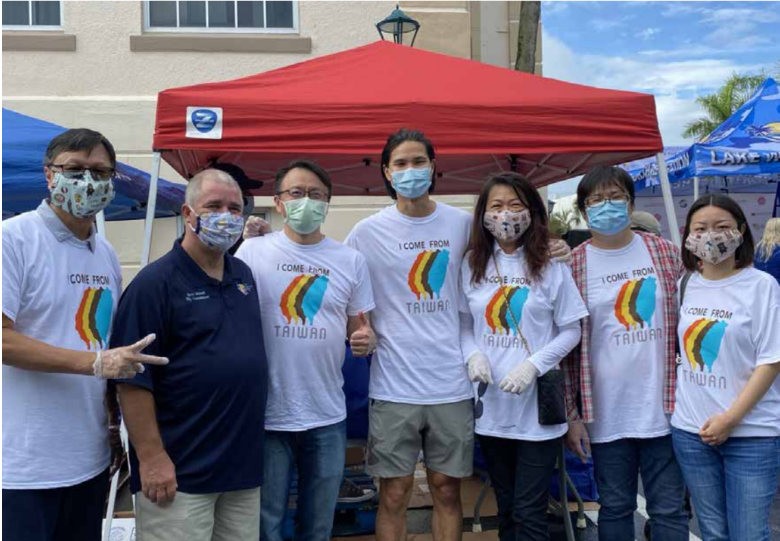
■ 錢總領事（左三）與僑胞身著「I come from Taiwan」T恤與沃思湖灘市市府人員合影留念。

這是一個有關駐邁阿密辦事處與南佛羅里達州沃思湖灘市市政府聯合發送食物，幫助居民度過武漢肺炎疫情難關的故事。