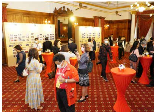
20週年茶會熱鬧溫馨舉行。

NGO代表們難得聚首，話題似乎聊不完，他們也感謝外交部藉由非政府組織國際事務會成立20週年時機，舉辦這場茶會，意義非凡。原本預計晚上7點結束