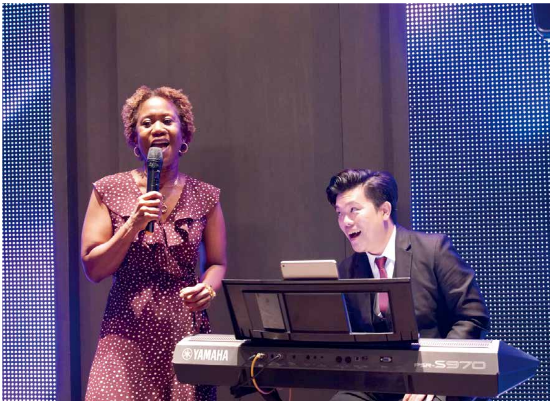
聖克里斯多福及尼維斯大使哈菁絲展現動人歌喉。