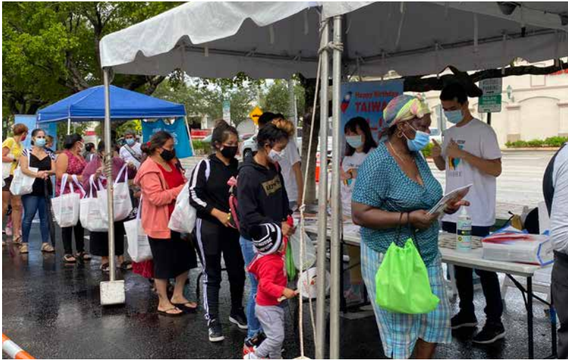
本處於現場向民眾發送臺灣國情簡介手冊及文宣品。