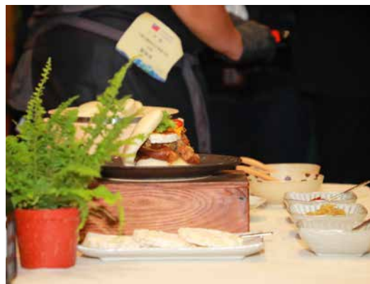
■ 國慶酒會獨家口味「滷肉飯風味刈包」。

與蔓越莓醬淋面精心製成。再來是臺灣寶島造型的包種茶慕斯蛋糕——「人之島」；最後則是蔡總統特別喜歡的「滷肉飯慕斯蛋糕」，店家以傳統滷肉飯意象，使用花生醬、白巧克力慕斯與肉鬆搭配，創作出鹹甜口味的法式臺灣美食。