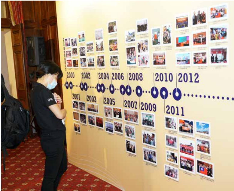
■ NGO代表仔細參觀時間軸照片牆。