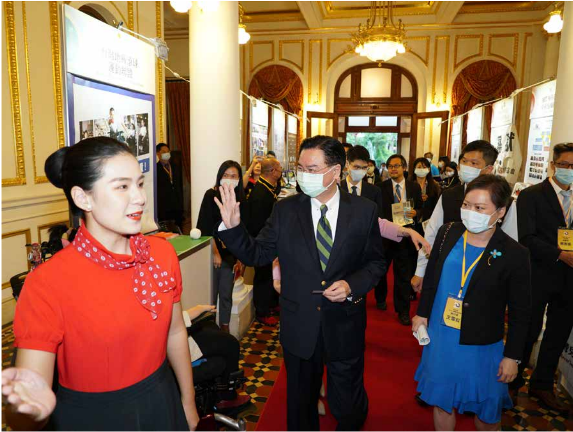
■ 吳部長參觀NGO展示攤位。

用iPad、海報或摺頁等文宣現場解說，並發送伴手禮，使得20週年茶會儼然成為一個小型的NGO成果展。