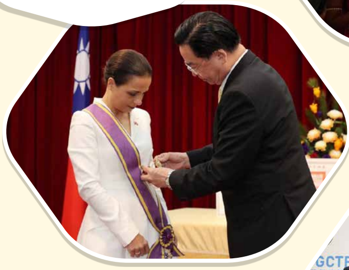
外交部長吳釗燮於109年11月9日為海地共和國駐臺大使庫珀配戴大綬景星勳章，表彰深化臺海邦誼的貢獻。