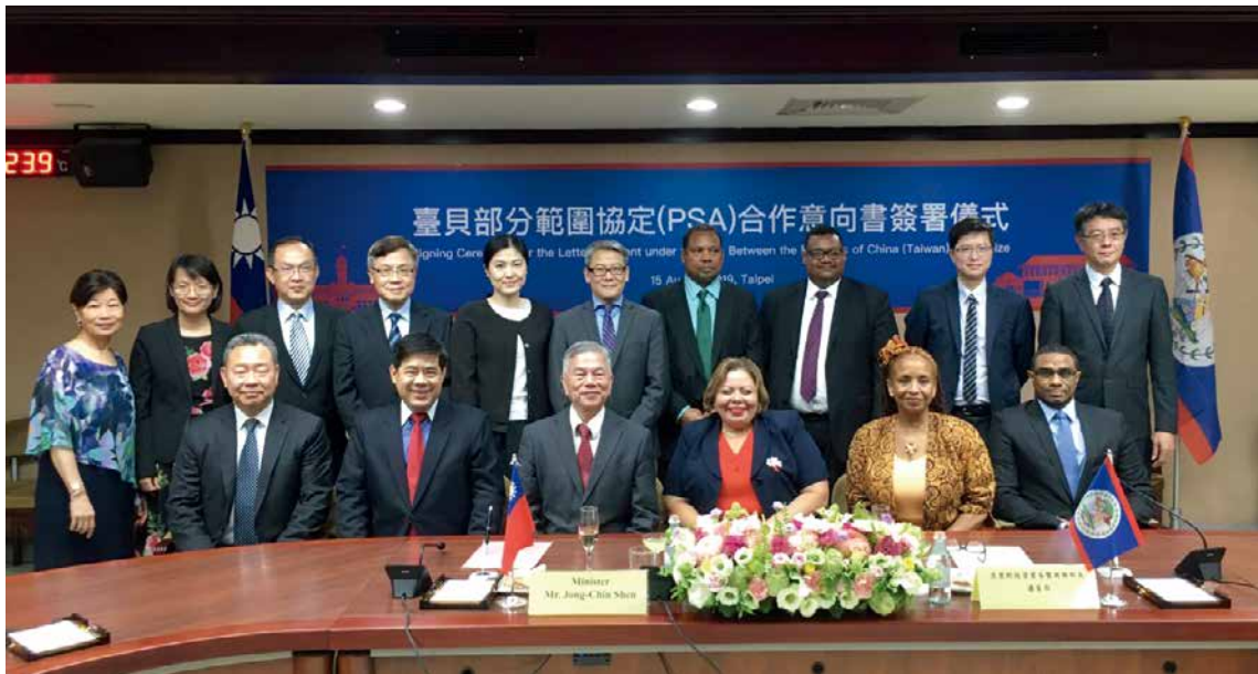
■ 臺貝「部分範圍協定」(PSA)合作意向書簽署儀式。