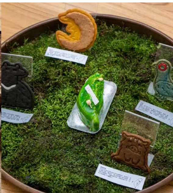
■ 「菓實日」之臺灣特有種動物餅乾組—臺灣黑熊、帝雉、野豬及穿山甲。(照片提供／「菓實日」)