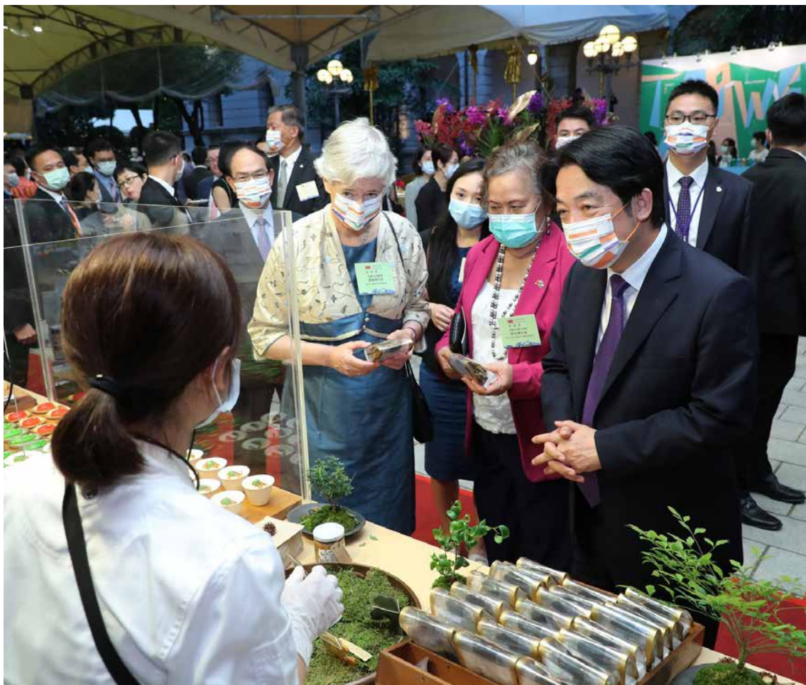
■ 賴副總統同駐臺使節及代表參觀攤位。

排場地空間，無法完整呈現跆拳道特技，而我們對於無法在酒會前確認特技表演的內容，頗感憂心著急，團長當時就以堅定的眼神向我們保證：「國慶當天一定會全力以赴，呈現最精彩的表演！」。看著團長熱情的眼神與堅定的語氣，我們感受到本次酒會對團員非凡的意義。酒會當晚，團員們穿上印有「TAIWAN」的跆拳道服，完美演出跆拳道結合街舞藝術的創意，蔡總統與使節代表們目不轉睛地欣賞「小鮮肉」團員們的精彩獻技，該團的演出更獲