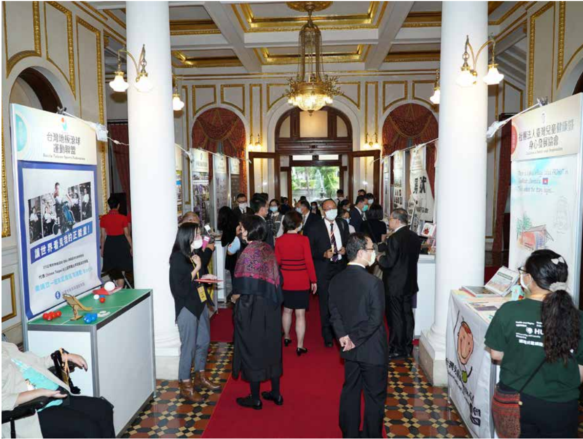
NGO展示攤位與賓客交流熱烈。

獎，並分類為公共政策、醫療衛生、人道援助、社會福利、環保永續及體育文化等六大領域。本會在8月初擬訂評選原則，經對外公布，9月初截止收件，總計有近80個民間團體報名，包括自行報名或經由推薦參加評選兩種方式。承辦同仁光是整理每個團體一疊疊的報名資料就是一件大工程，但這也充分顯示國內NGO對政府活動的熱情響應與支持。