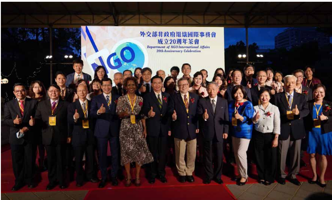
■ 吳部長與32個獲獎NGO代表合影。

文·圖 張知萱 \ 非政府組織國際事務會專員 攝影 胡子友 \ 公眾外交協調會攝影師