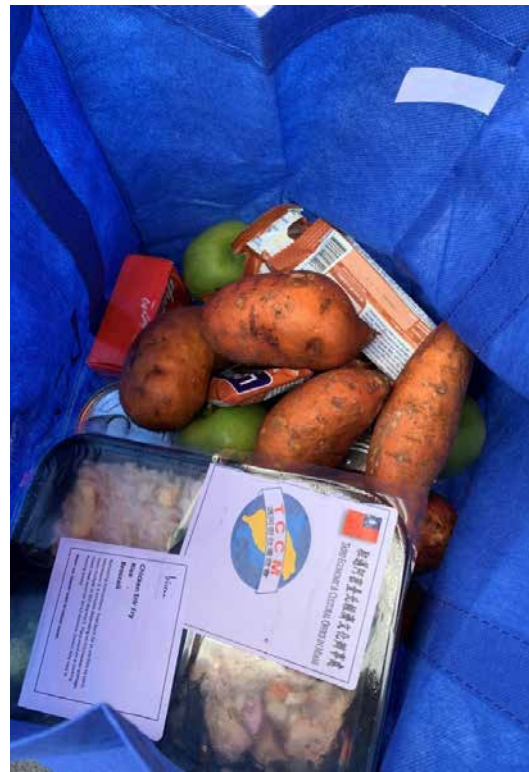
發送的食物袋含有餐盒、蔬果、罐頭等民生用品；餐盒上面的貼紙印有中華民國國旗。

寫到這兒，也許有人要不禁問了，佛州的武漢肺炎（COVID-19）疫情如此嚴峻，駐處哪還能舉辦活動，又會有人捧場嗎？事實上，這場活動正是因疫情而起！今年春季以來，肆虐全球的武漢肺炎疫情使得以觀光產業為主軸的佛州經濟受到重創，商業活動停擺，不少居民被迫放無薪假，甚至遭解雇而失業，也導致許多家庭頓失收入來源，生活陷入困境，其中又以社會基層的弱勢族群受到最嚴重的衝擊。他們本已收入不豐，艱困的生活如同雪上加霜。佛州是臺灣的姊妹州，雙邊情誼深厚，在這個困難的時刻，這些受到疫情打擊的人們更需要身為姊妹的臺灣人伸出援手。因此，幾經會商評估之後，本處決定捐贈食物與民生物資給多數居民為我友邦海地及瓜地馬拉移民的南佛州棕櫚灘郡沃思湖灘市（City of Lake Worth Beach, Palm Beach County），並與市政府敲定於10月3日上午在市政大樓前廣場舉辦發送活動。我們同時號召邁阿密臺商會、邁阿密青商會及南佛州四校聯合臺灣同學會等當地主要僑團及留學生團體共襄盛舉。