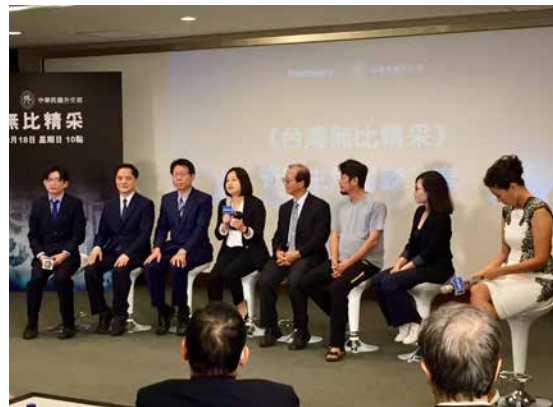
「科技新台灣」記者會。