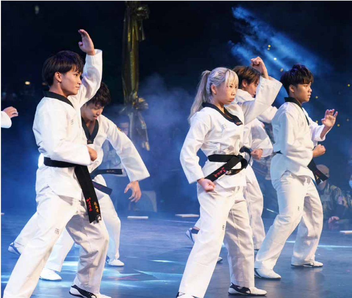
「We.R特技跆拳道表演團」跆拳道街舞演出。

得媒體的一致好評。當晚各項別出心裁的節目，也讓本年酒會成為防疫期間為藝文團體紓困的表演藝術盛典。