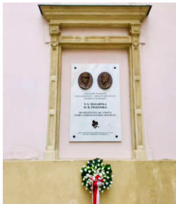
建國百年緬懷二位開國英雄之牆上紀念碑

去年10月1日至6日舉行的第60屆捷克布爾諾國際工業展，是中東歐地區最大的工業展。該工業展開幕式後，捷克總理Ondrej Babis及