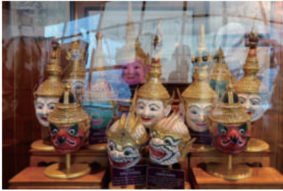
泰國筇劇演員之實體面具