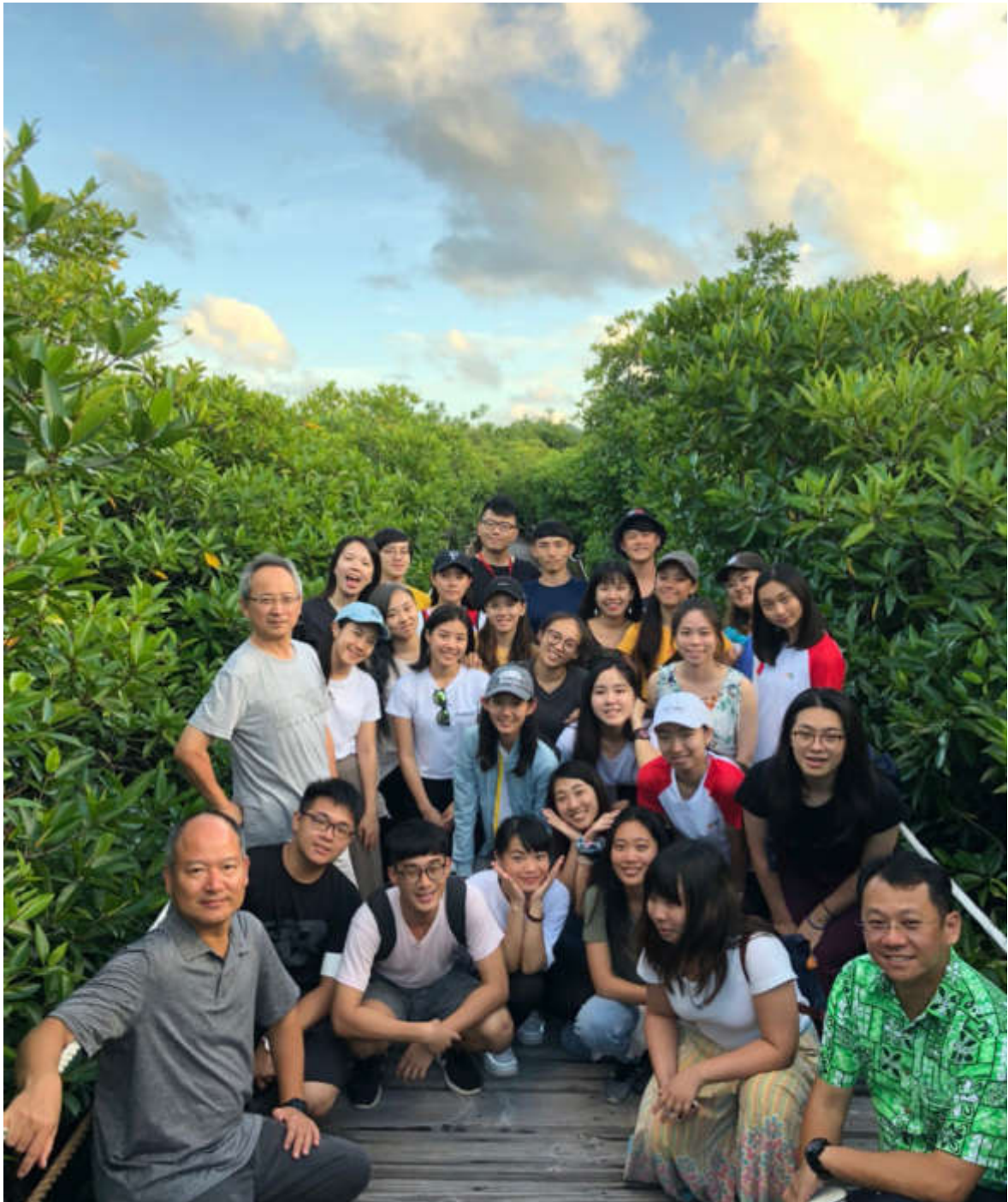
參觀紅樹林生態區，並在夕陽下合影留念。