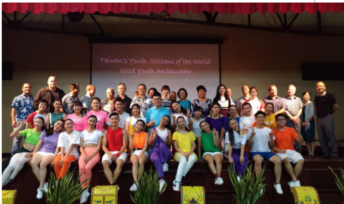
本團於文化中心進行「臺灣之夜」，演出順利圓滿。