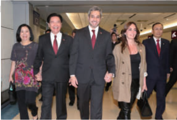
▲吳部長歡迎巴拉圭共和國總統阿布鐸伉儷訪團抵臺