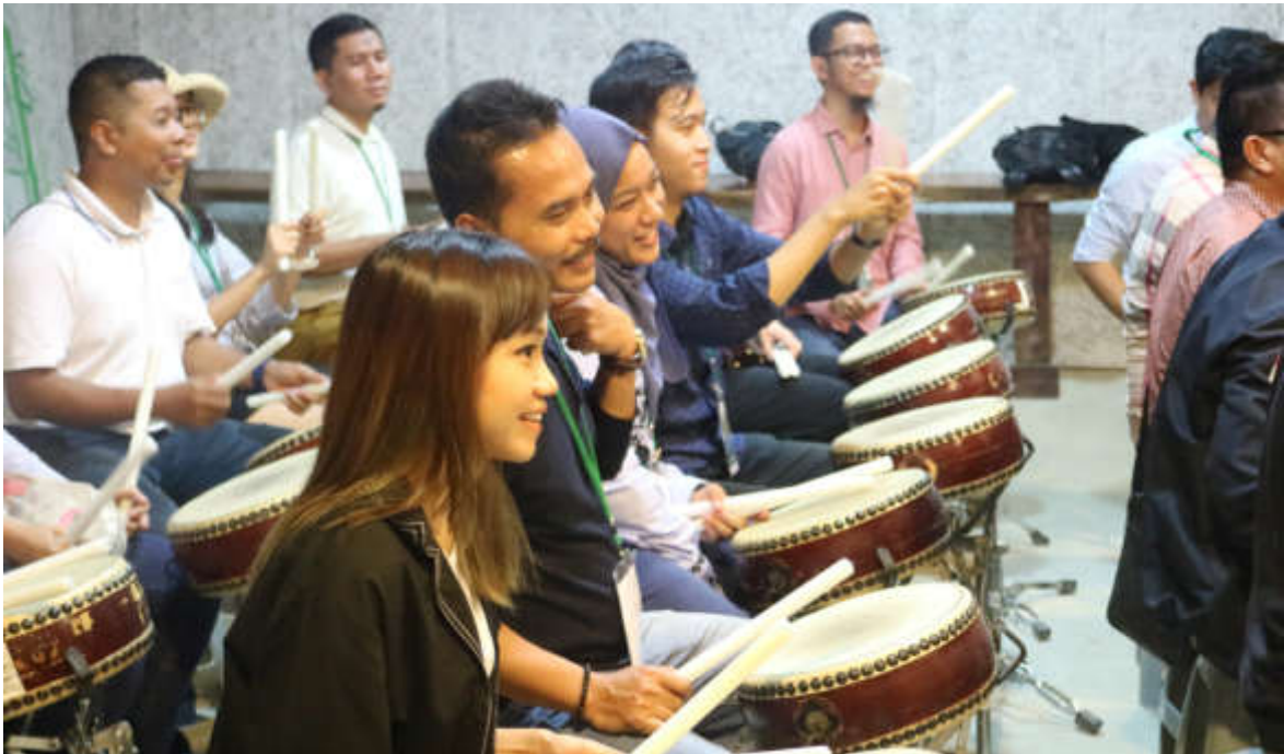
橋頭十鼓文創園區打擊體驗

12月3日恢復直航，我與東南亞各主要信奉伊斯蘭國家人民間往來互動之緊密可見一斑。