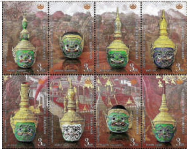
泰國郵政公司以筇劇面具發行紀念郵票

筇劇列入人類非物質文化遺產代表名錄。此項決定立即獲得泰、柬兩國政府的高度肯定與讚揚。泰國文化部表示，為彰顯泰國傳統皇家筇劇舞蹈魅力，將舉辦一系列慶祝活動，包括向國內外遊客展現這種傳統藝術的觀賞方法和美妙的肢體語言，同時加強保護措施，引入現代化的聲光特技，使這種傳統文化表演能得到更多年輕一代的喜愛，成為宣揚泰國形象的藝術表演之一。