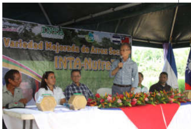
11月8日吳大使與農牧科技署長Miguel Obando共同主持「稻種計畫新品種INTA NutreZinc發表會

（三）菜豆計畫：2016年5月執行，至今已成功研發4項新品種，完成在全國設立210個