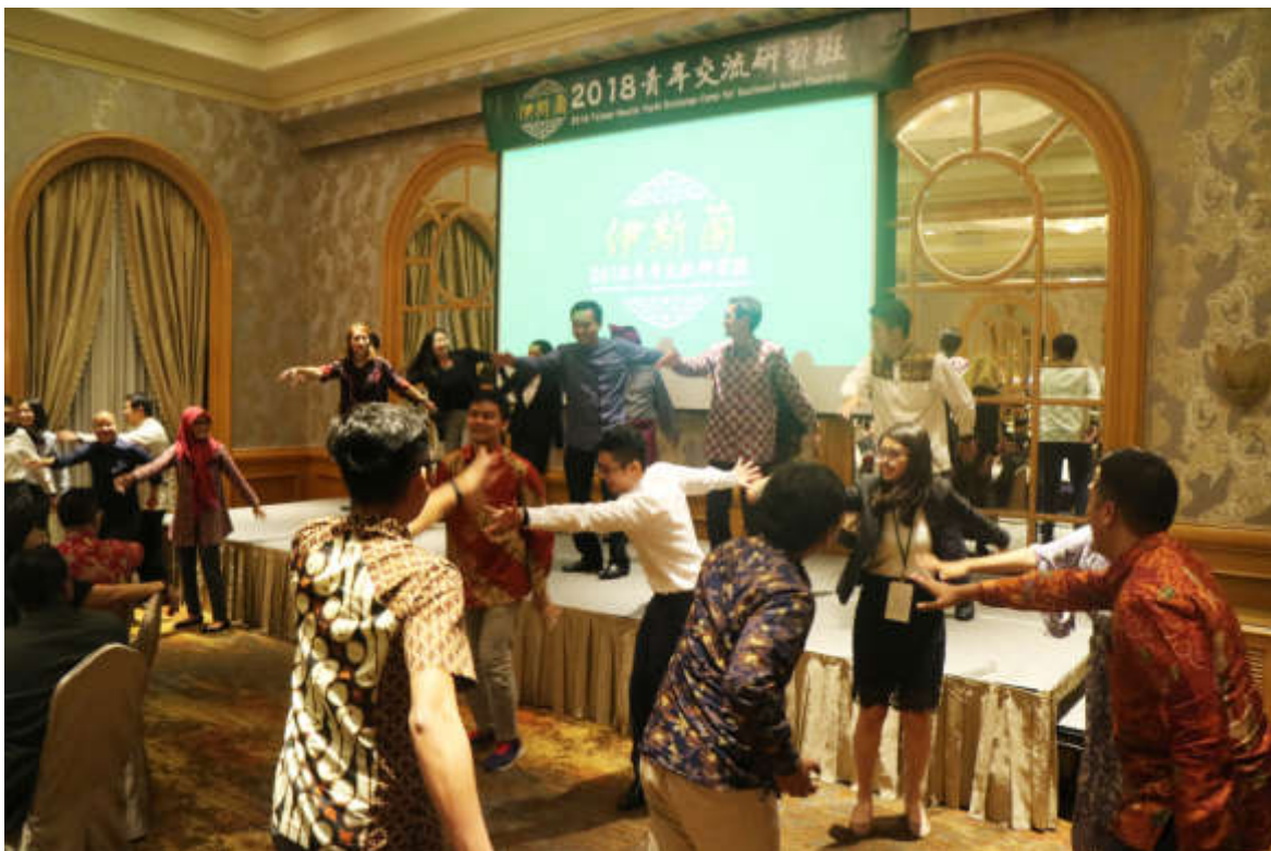
結訓晚宴才藝表演