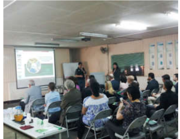
聽取「惠嘉電實業」簡報

佼者，在增加地球資源使用效率、減少浪費與廢棄及挹注資源循環度等方面多具有獨步全球的技術。國經司事前要求「整廠協會」先蒐集廠商的發展願景與全球佈局等資訊，事前即提供給參團駐臺使節參考，有助他們協助引介商機或尋求技術支援，並認同臺灣「循環經濟」業者擁有先進的實力，拓展海外市場榮景可期。