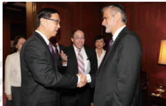
▲曹次長宴以色列前副總理暨團結黨伊夏黨主席