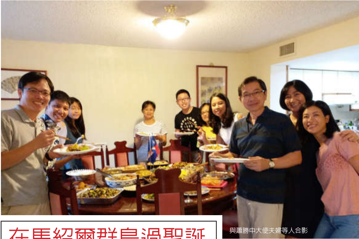
與蕭勝中大使夫婦等人合影