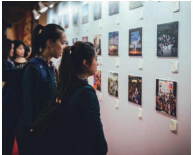
青年大使參觀攝影展

大專院校師生多年來熱心參與這個交流計畫，協助我國的年輕世代培養國際觀，以及對這塊土地的使命感。