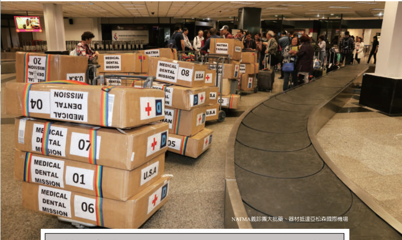
NATMA義診團大批藥、器材抵達亞松森國際機場