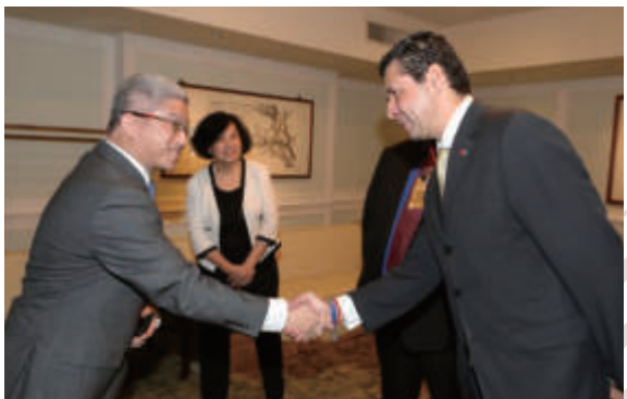
▲徐次長款宴第一屆「全球留台傑出校友獎」獲獎人宏都拉斯經濟發展部長傅哲倫