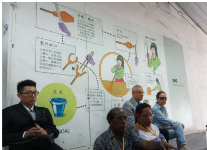
鍛燒工廠內牆作業流程圖