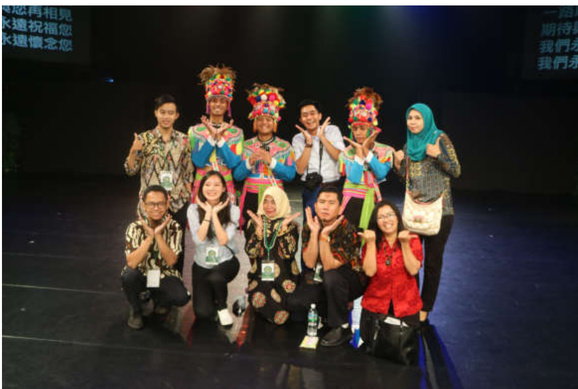
參訪原住民族文化發展中心