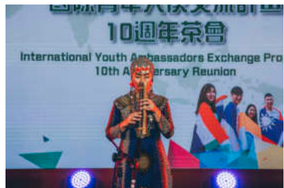
青年大使呈現原住民族文化

個領域，包括醫療衛生、民間企業、教育、非政府組織、甚至國防等，都有傑出的表現。部長表示，樂見於10週年慶活動之際成立「國際青年大使外交之友會」，延續青年大使的情誼及力量，期勉青年大使永遠記得當初心中的那份感動與熱情，未來無論身在何方，都能繼續擔任臺灣的最佳代言人。吳部長最後也感謝各