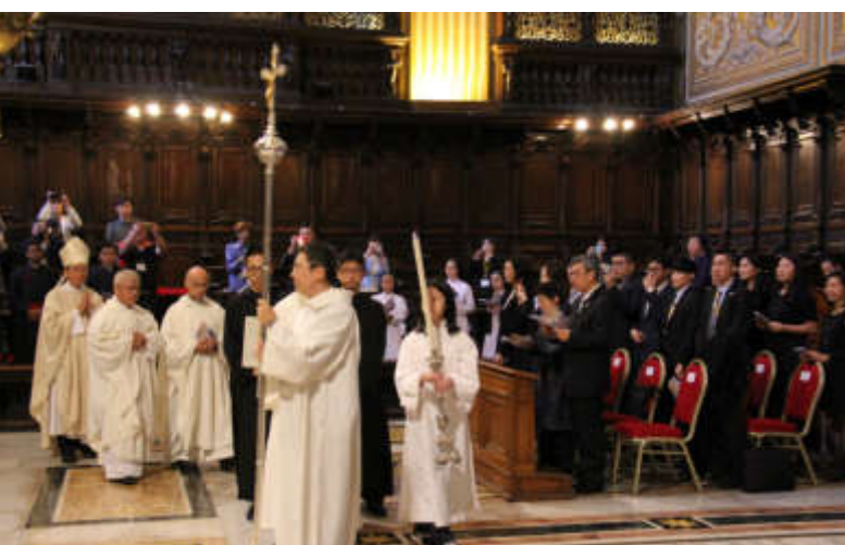
陳副總統一行參加在聖伯多祿大殿聖詠小堂舉行的「為臺灣與世界和平祈福彌撒」