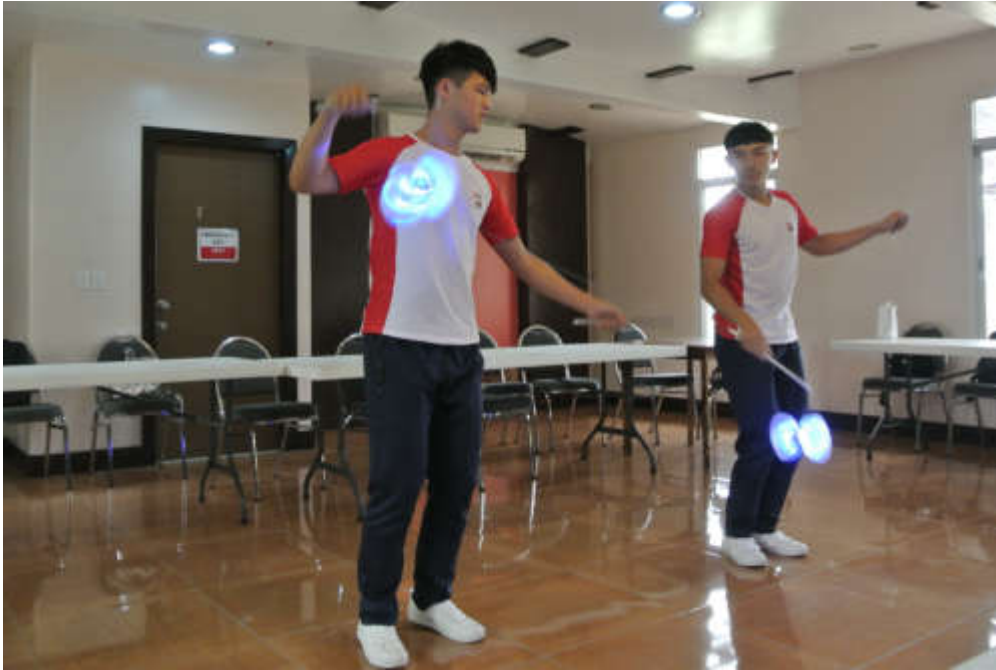
團員於帛琉社區學院進行扯鈴表演

時，當地學生演唱中文歌曲「甜蜜蜜」熱情歡迎團員，頓時一股暖意湧上心頭！交流過程中，團員與當地學生分享生活點滴，現場洋溢著歡樂氛圍，團員也展現青春活力帶領學生一同唱跳，在本團兩位具扯鈴專長的團員帶動下，氣氛更為歡樂。晚間本團於帛琉文化中心舉行「臺灣之夜」精采表演，表演內容分別為臺灣節慶、山林之美、民俗文化及喜樂臺灣4個主題，藉由舞蹈及扯鈴呈現臺灣之美，現場來賓對於此次演出都給予極高的喝采與肯定！