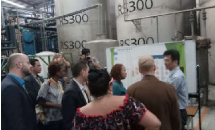
參觀「聚泰環保材料科技」公司生產工廠內部