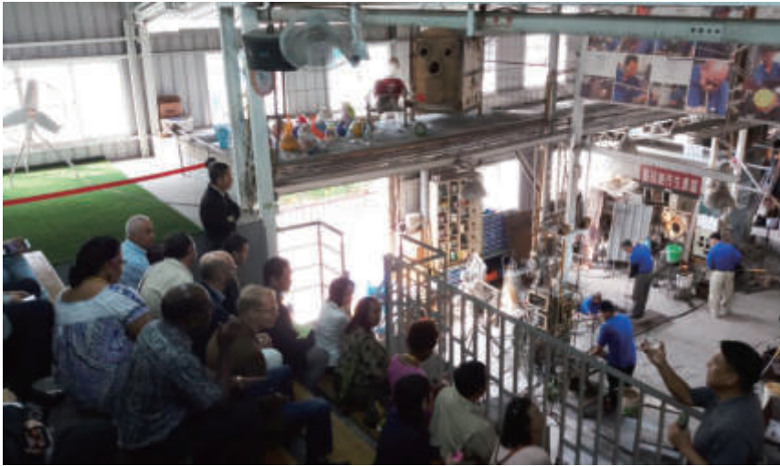
應邀參觀高溫鍛燒工廠內部運作一隅

量使用再生粒料（recycled material），以彰顯推動「循環經濟」不僅是回收再利用，更能創造經濟價值的目標。