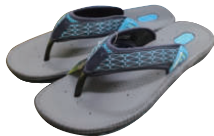
大使加碼贈送每人一雙拖鞋

過了聖誕節，跨年就不遠了，過節的開心將繼續延續到跨年夜及隔年元月一日，期待也珍惜在這個美麗島國和大使館、技術團的夥伴及臺灣鄉親們共度的每一段好時光。🇹🇼