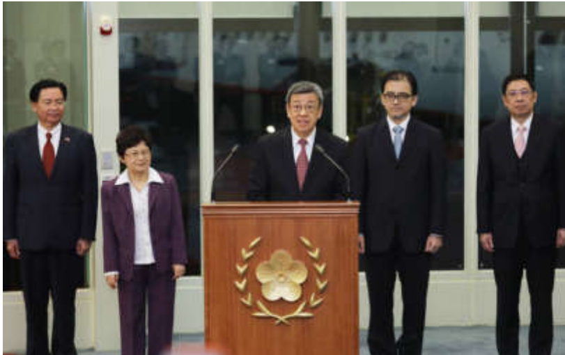
陳副總統啟程登機前發表談話