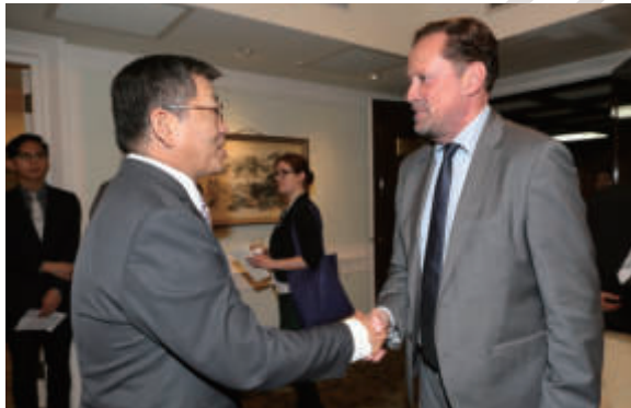
▲謝次長宴德國下薩克森邦議會基民黨黨團主席陀飛