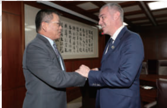
▲謝次長宴法國國民議會友台小組主席賽沙里尼