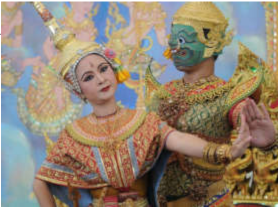
泰國筇劇—十首魔王與女主角劇照

「筇劇是誰的？泰柬網友掀口水戰—文化部12月主動申請註冊非物質文化遺產」報導指出，泰國文化部準備向聯合國教科文組織提交申請，以將筇劇註冊成爲非物質文化遺產，但此一舉措引起柬埔寨網友的嚴重不滿。柬埔寨網友的聲討不僅局限在筇劇的表演形式，還延伸至筇劇表演者的服飾裝扮、面具及髮飾等。對此，泰國網友也列出一系列證據，證明筇劇舞蹈表演在泰國擁有上百年歷史，而柬埔寨長期陷於戰亂，以至於戰爭結束後該國的藝術文化遭到破壞，還是在泰國王室教師的幫助下最後才得以復甦云云。