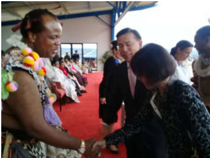
梁大使夫婦晉侯史王