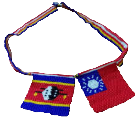
「臺灣兵團」成員所戴的兩國國旗項圈