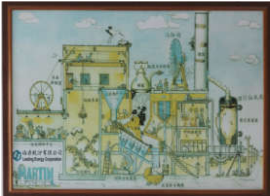
「倫鼎公司」垃圾焚化發電流程