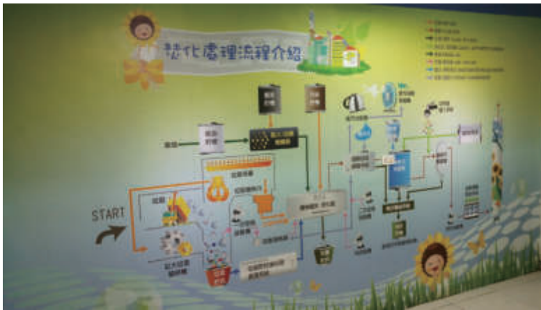
焚化處理再利用流程

以妥善運用，以替代自然資源開採，達成物質全循環、零廢棄的願景。欣見臺灣許多企業已參與開發「循環經濟」的行列，畢竟這是影響未來10年的全球十大趨勢之一。