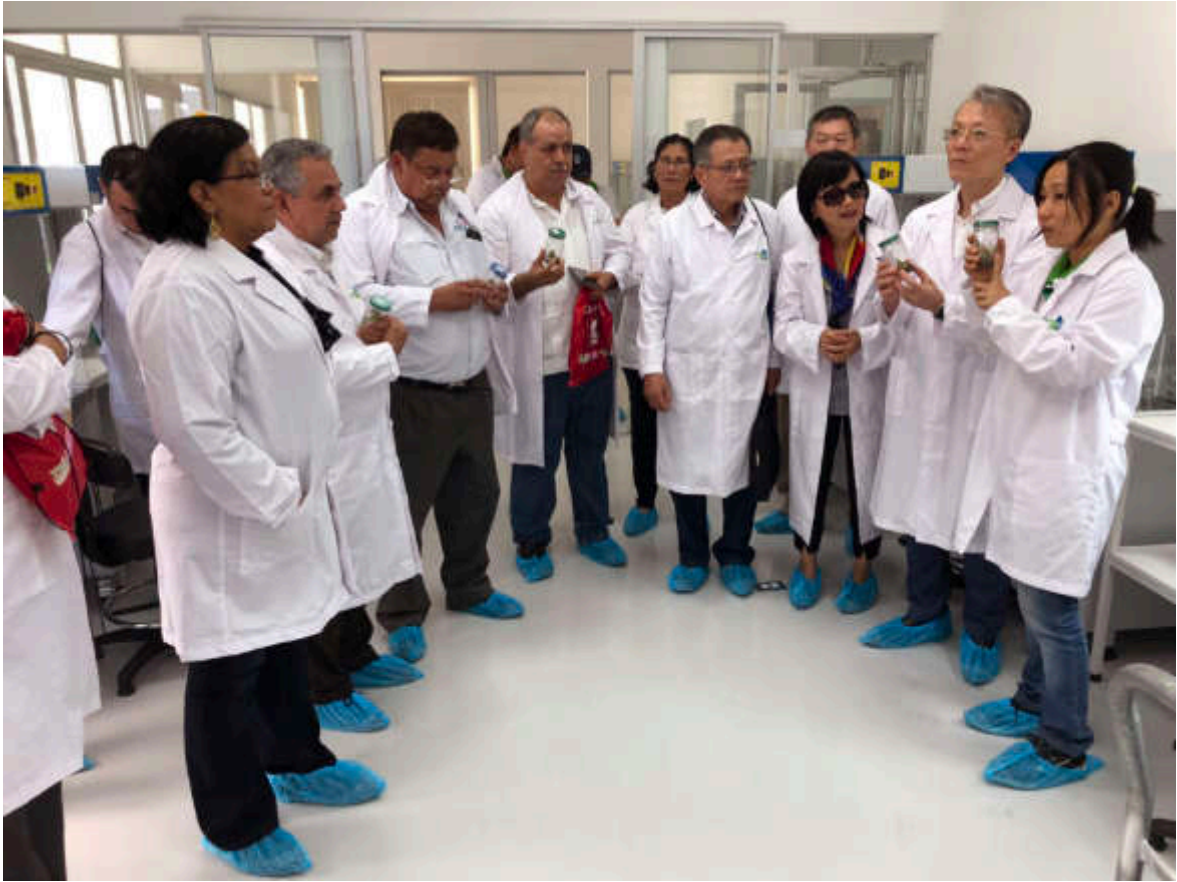
10月25日吳大使夫婦與農牧科技署共同署長Miguel Obando及Claudia Cárdenas主持煮食蕉計畫國家組織培養中心落成啓用典禮，參觀中心實驗室情形。