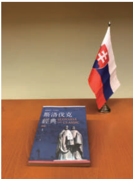
國人出版專書-斯洛伐克經典

第一次世界大戰結束迄今正好百年，捷、斯兩國自1918年共同建國起，歷經德國納粹、蘇聯及共黨統治，多次更改國名、領土變遷及政治體制頻繁更迭，其中1944年的反抗起義及1989年推翻共黨的統治，可謂名垂青史，展現