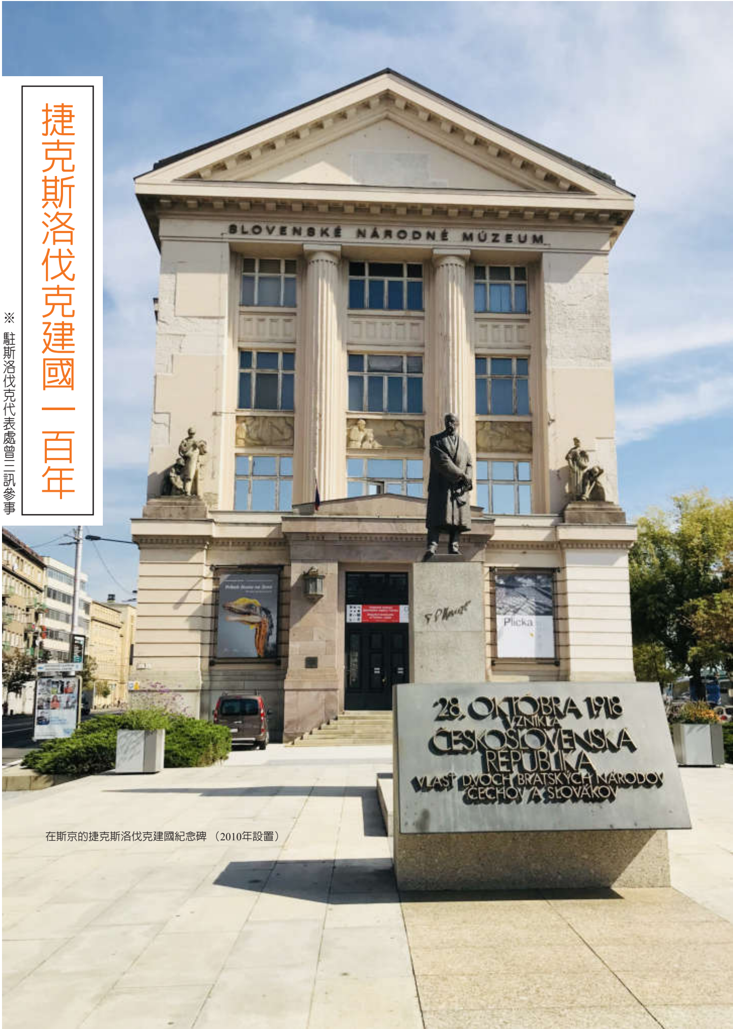
在斯京的捷克斯洛伐克建國紀念碑（2010年設置）