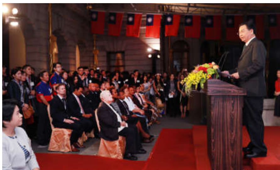
吳部長致詞感謝國際青年大使遠赴世界各地為臺灣發聲

承辦本計畫的非政府組織國際事務會認為此一由青年大使主動提議的構想，有其長遠效益，吳部長對此亦深表支持。因此，藉由慶祝國際青年大使計畫10週年有成之際，除請部長在臺北賓館主持茶會，邀請歷屆青年大使共同參與外，席間並宣布正式成立「國際青年大使外交之友會」。此一組織的成立，除能進一步維繫本部與歷屆青年大使的互動，將歷年青年大使串聯為網絡外，更能彰顯外交部推展青年參與國際事務的成效，以及本計畫對參與青年職涯的正面影響。