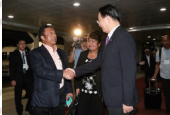
▲吳部長歡迎帛琉總統雷蒙傑索伉儷訪團抵臺