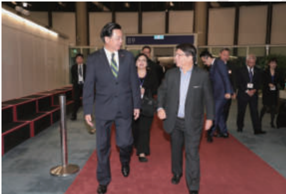
▲吳部長歡迎尼加拉瓜外交部長孟卡達抵臺