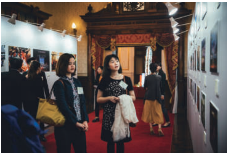
茶會舉辦攝影展，讓青年大使重溫當年出訪情形