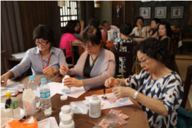
本館館員眷屬及僑胞志工包藥情形