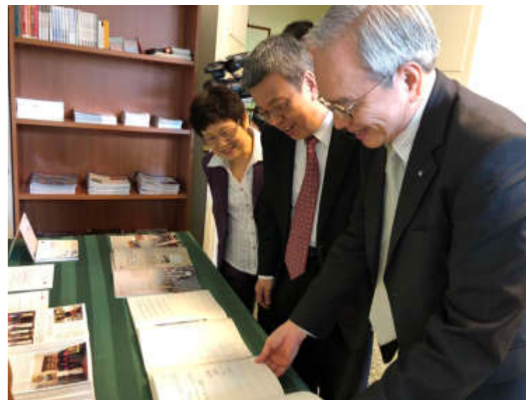
陳副總統伉儷視察大使館