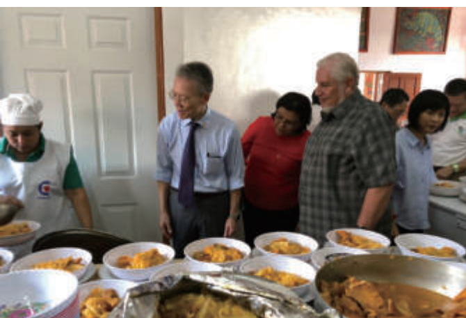
11月12日吳大使夫婦與Masaya市長Orlando Noguera及家庭經濟部秘書長Josefa Torres共同主持「一鄉一特產計畫」共識營開幕式，參觀Masaya美食Modongo牛肚蔬菜湯烹煮過程。