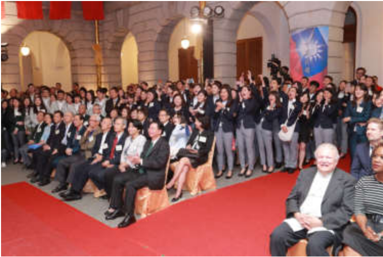
活動現場氣氛熱烈