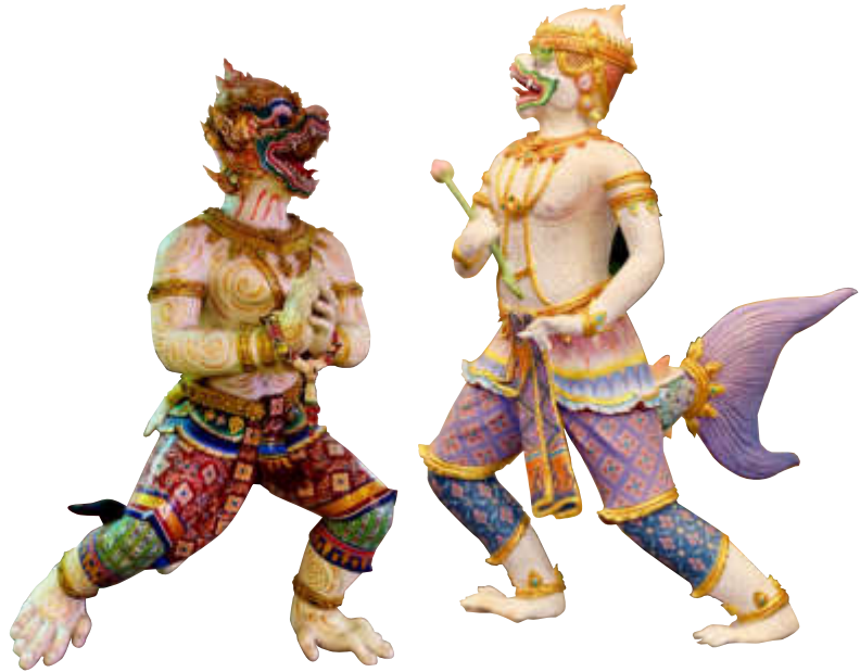
泰國筓劇之白猴王「哈努曼」塑像

「柬『面具舞』正式申遺」：柬埔寨文化藝術部於2017年3月29日正式向聯合國教科文組織提交「面具舞」申遺審查，預計將花費兩年時間決定是否批准「面具舞」列入人類非物質文化遺產名錄。柬文化技術局長哈杜表示，柬埔寨不會反對也不會擔憂泰國也將「面具舞」申請列遺，因為每個國家都擁有自己的文化。文化藝術部發言人泰努拉宋亞也強調，我們可以看到柬埔寨與鄰國有相似的文化，但是如果仔細觀察，柬埔寨面具舞與泰國面具舞之間有些差異。因為面具舞是柬埔寨一種優雅、古典而華麗的傳統戲劇舞蹈，加上樂曲旋律的不斷變化，這些元素的增加使得面具舞有別於傳統的戲劇表演，因此沒有人稱其為戲曲