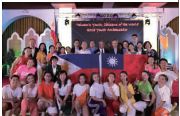
於University of Santo Tomas進行「臺灣之夜」舞蹈演出，表演順利圓滿

人民生活品質。而菲律賓，雖不是邦交國，但卻是臺灣南方最為鄰近的國家，因此雙邊經貿往來非常熱絡，在當地有許多臺商經營投資，駐地的外交人員因此須與臺商維持良好互動，而因身處非邦交國，外交人員如何克服困難在駐地深化臺菲合作關係，也是一大挑戰。