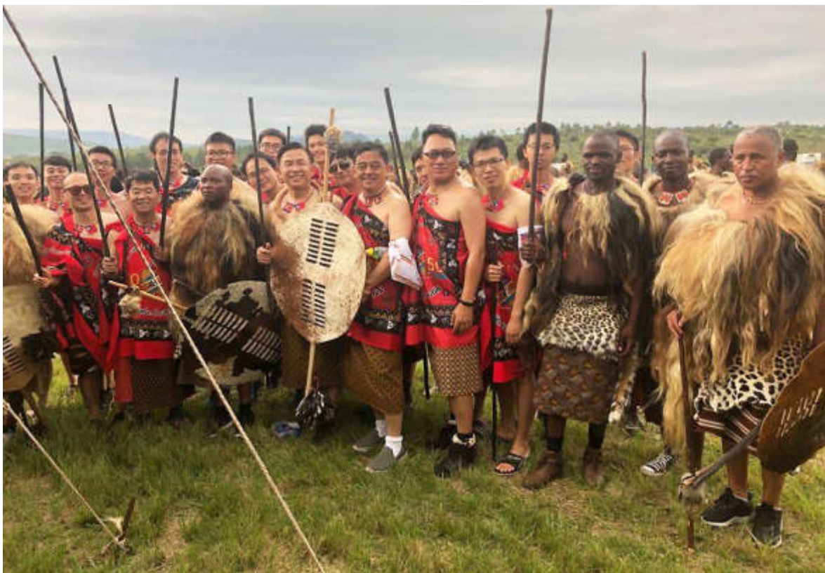
臺灣兵團與史國兵團合影

們再以新灌木更換牛棚中史王專屬圍籬的枯舊灌木。第4天上午，史王會在牛棚品嚐當年新產的新鮮水果，勇士節活動此時達到最高潮，也因此「勇士節」又稱為「初果節」(First Fruits Ceremony)。當日下午，民眾蜂擁參加史王主持的主日活動，繼以載歌載舞的方式跨夜歡慶。最末的第6天，史王會象徵性以勇士取回的聖水洗滌身體，並將吃剩的果實、食物