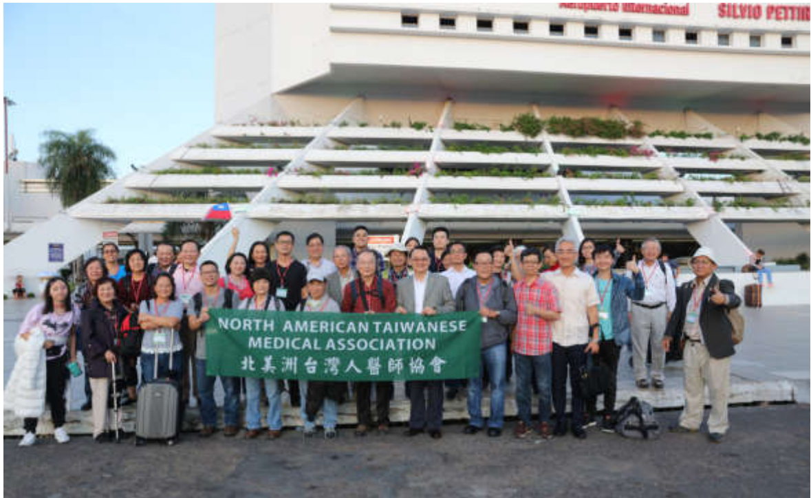
駐巴拉圭周麟大使偕相關館員前往接機於機場外合影

森盧克綜合醫院院長及牙科部主任協調義診時的各項需求。巴方在可行範圍內，都給予義診團最大的便利與支持。