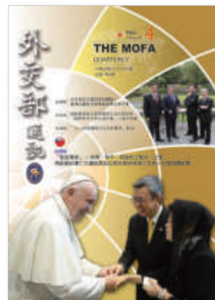
(封面右上方照片圖說) 本部吳釗燮部長(右二)偕謝武樵政務次長(左二)、徐斯儉政務次長(右一)及曹立傑常務次長(左一)於臺北賓館向外交部官方臉書粉絲問候。

出版機關 / 外交部 編輯 / 外交部公眾外交協調會 電話 / 886-2-2348-2999 網址 / www.mofa.gov.tw 地址 / 臺北市凱達格蘭大道二號 設計印刷 / 沈氏藝術印刷股份有限公司 地址 / 臺北市南港區重陽路 461 號 12 樓 電話 / 886-2-7709-4328 本刊言論為作者之意見，不代表政府或本部立場 本刊圖文非經同意不得轉載