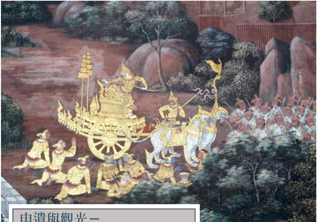
泰國大皇宮「羅摩衍那」壁畫—白猴王駕車圖