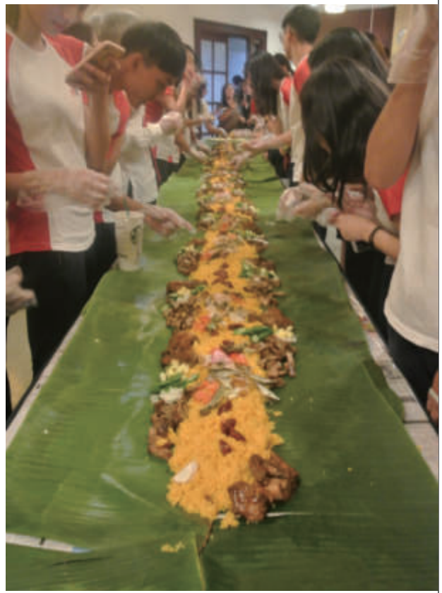
Lyceum of the Philippines University 學生交流，一起吃手抓飯

此次參訪之旅，因分別前往邦交國及非邦交國，對於身處邦交國及非邦交國外交人員的任務也有了不同的體驗。以帛琉而言，因是我國重要的邦交夥伴，在該國參訪5天行程，首次見識到第一線的外交人員如何盡心盡力為臺帛之間創造更多的交流，並為鞏固臺帛雙邊友誼努力，我國派駐在當地的技術團，與外交人員也培養了良好工作默契，共同協力改善當地