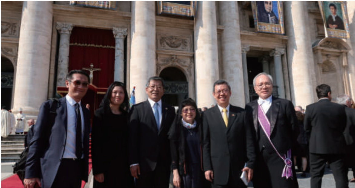
陳副總統伉儷偕謝政務次長、李大使及歐洲司同仁合影