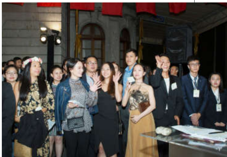
歷屆青年大使出席踴躍