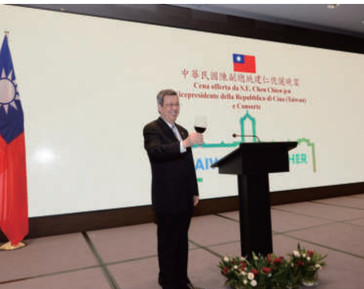
陳副總統伉儷宴請旅居梵蒂岡及義大利的我國天主教神職人員及僑界代表