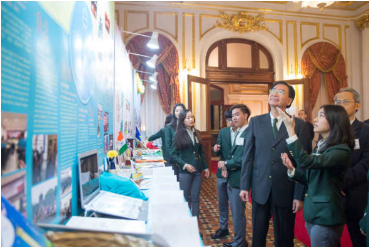
吳部長參觀國際青年大使出訪成果展示攤位