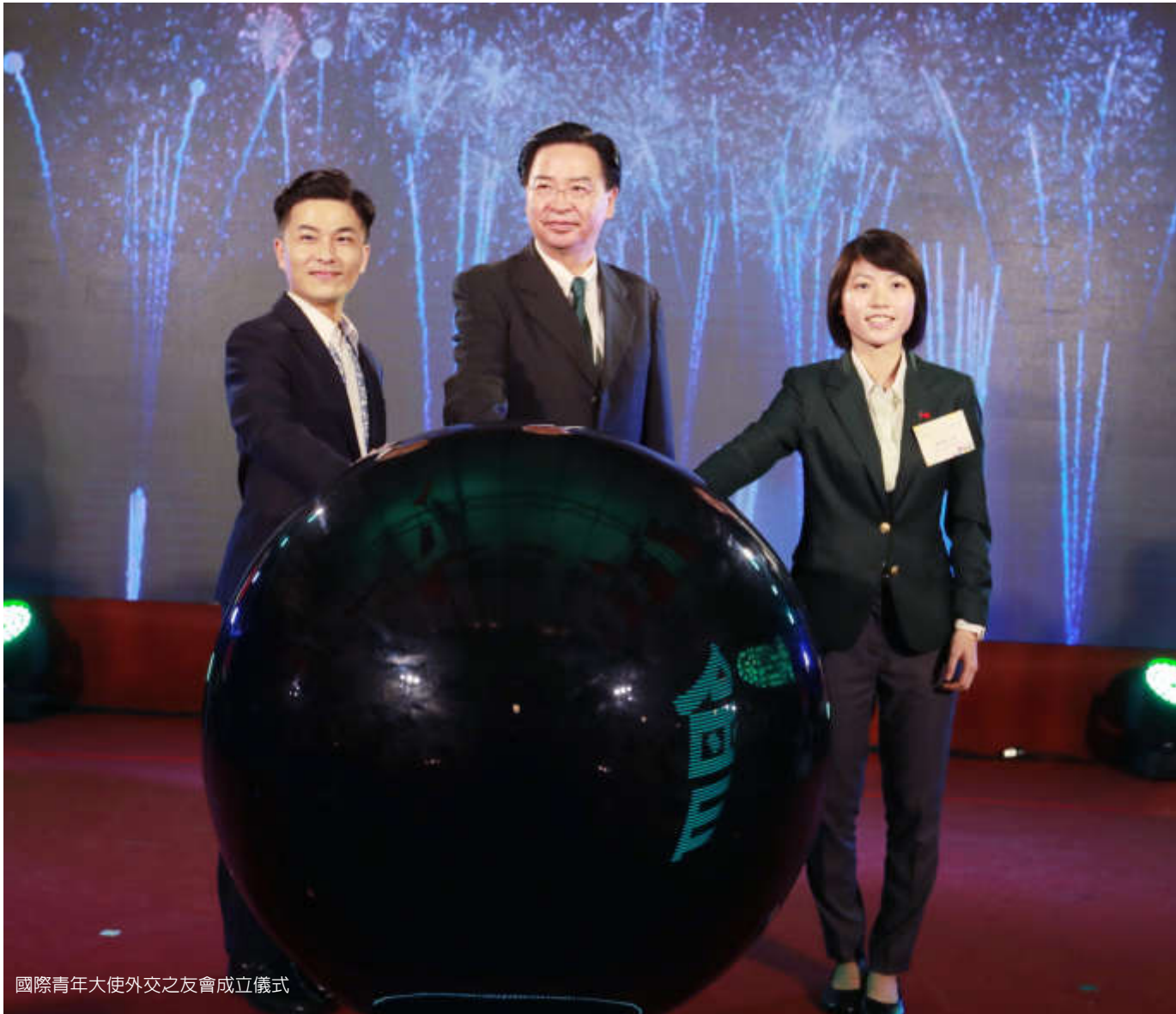
國際青年大使外交之友會成立儀式