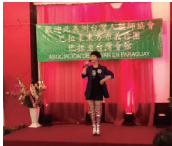
臺語歌后詹雅雯餐會高歌饗宴東方市僑胞