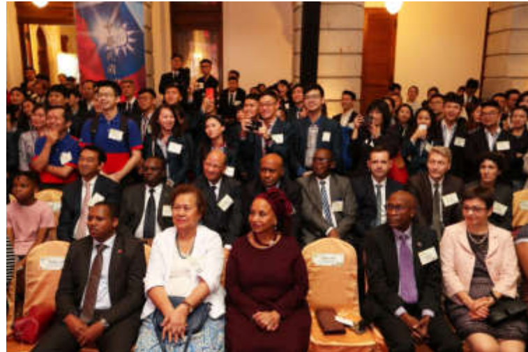
超過廿位駐臺使節及代表官員出席共襄盛舉