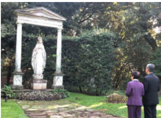
陳副總統伉儷在教宗夏宮花園的小聖母像前禱告

陳副總統一行隨後前往距羅馬約150公里遠處的天主教本篤會卡西諾山（Montecassino）隱修院參訪，並在聖本篤及聖思嘉的墓穴前祈禱。卡西諾山隱修院是本篤會創辦人聖本篤（Saint Benedict of Nursia）於西元529年創建，後來成為西方隱修制度的鼻祖。該隱修院長期以來被視為天主教聖地，也曾在二次大戰期間，成為交戰時的平民保護所。先教宗保祿六世於1964年10月24日宣布本篤會創辦人聖本篤為「歐洲主保聖人」，並讚揚他為「和平的使者」，也提到隱修院重建的一磚一牆都見證了和平的重要，是人類化干戈為玉帛的典範。隱修院大門入口的拱門上方特別書有意為「和平」的大紅色拉丁字