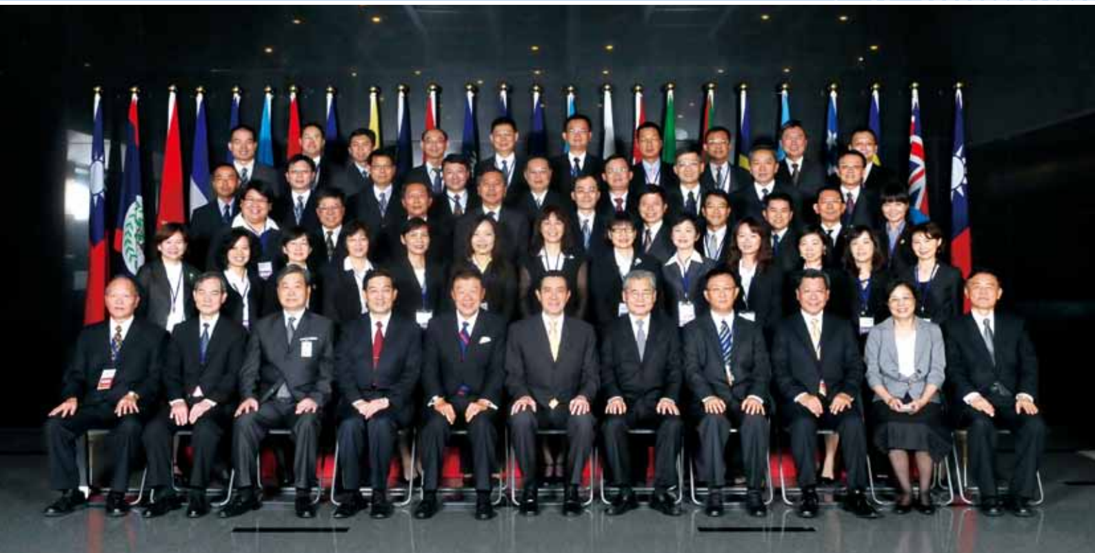
●馬總統與參加開訓典禮貴賓及全體受訓學員合影。

美國政府任命為國際法院的法官，之後還經常出現在校園和他的研究室中，我問他說你不是到海牙去了嗎？他說：「馬先生，國際法院法官的工作比較像是義勇消防隊。」可是 WTO 就不一樣了，WTO 非常忙，案子很多而且龐大複雜，因此很需要各方的人才，這時候他們就發展出一個 WTO Practice，也就是雇用專辦這些業務的律師。