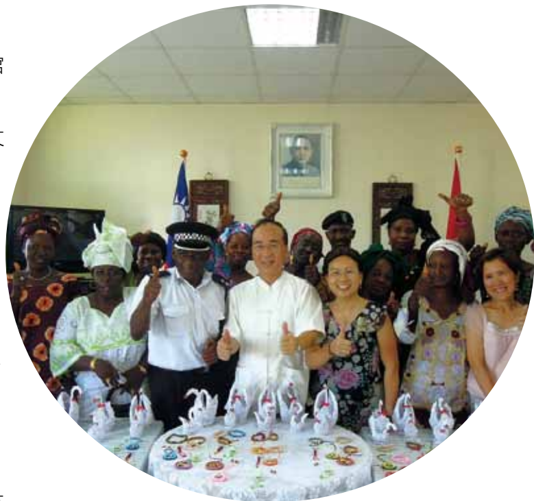
●陳大使夫人開設中國結及紙藝班，成績斐然。 圖為警察眷屬班結業式。

本文化中心是我國在非洲地區唯一成立的「臺灣文化中心」，難能可貴，希望能拋磚引玉，起一點示範作用。特藉此文感謝出力協助推動文化交流的各位工作同仁、眷屬，及國合會與其所派的志工老師，並與大家分享此一工作成果。