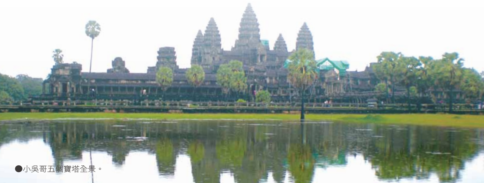
●小吳哥五個寶塔全景。

甚似吳哥王朝的寫照，此時，不知是情堪回首而泫然欲涕，抑或是驚奇古蹟之鬼斧神工？仰首問蒼天，只聞歷史印證流逝的歲月，歲月牽引著今昔與未知的往後，且聯結著生命的歷程。生命的精采與空白，卻留待方寸一念間，願我們保守我們的心勝於一切，因一生的果效是由心發出。此番與神笑談印心田，單單釋然託穹蒼，平安喜樂溢滿懷。