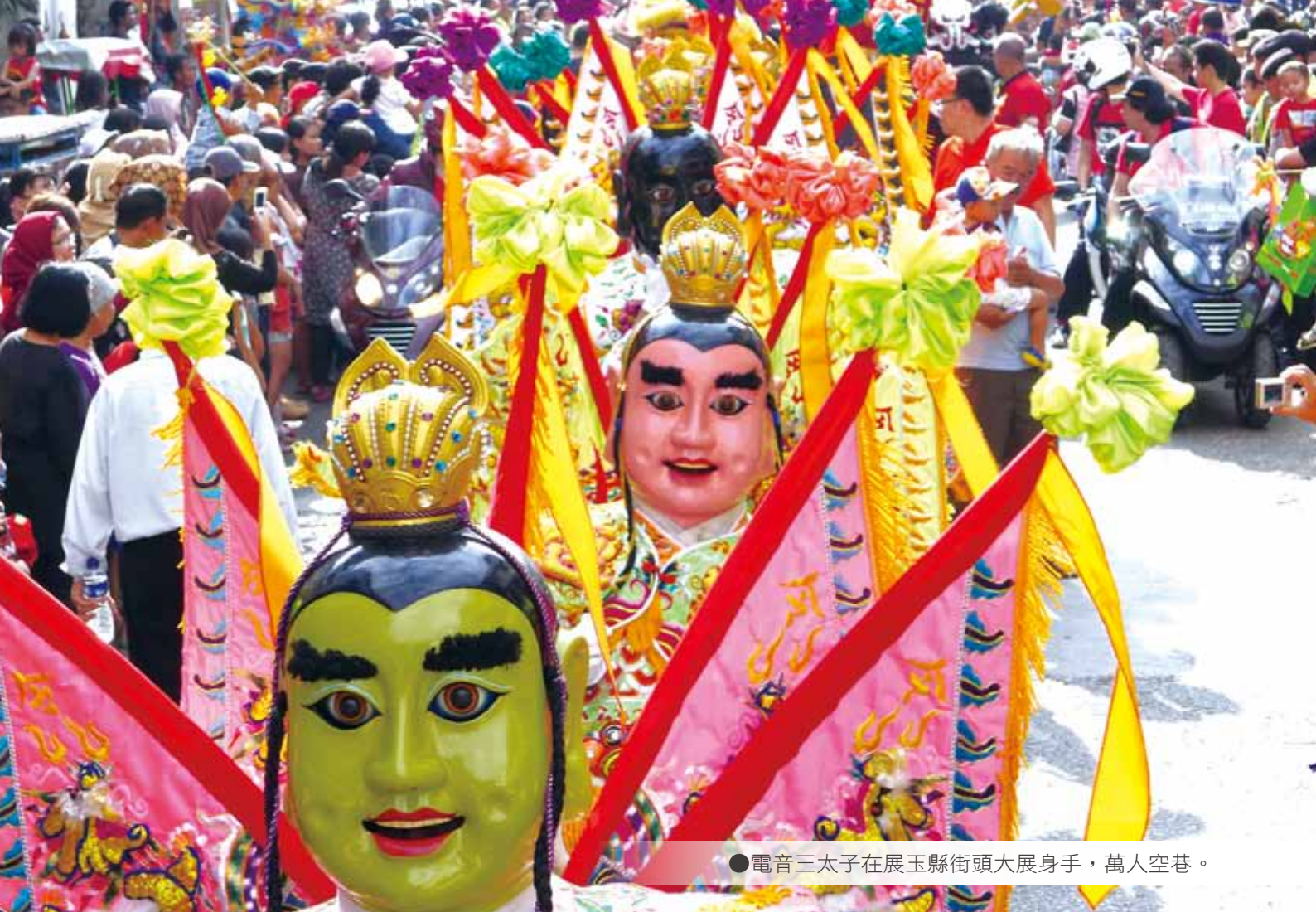
●電音三太子在展玉縣街頭大展身手，萬人空巷。