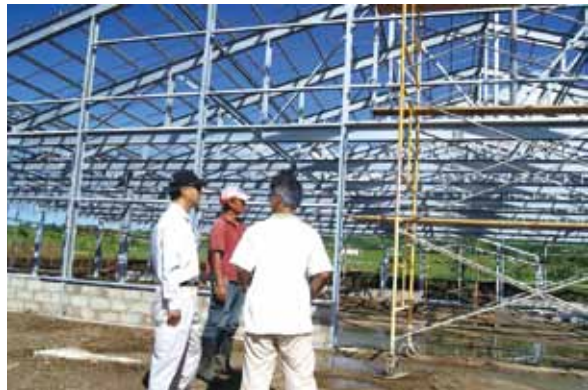
●建造溫室地基與鋼樑過程，後方著紅衣者即為小高。