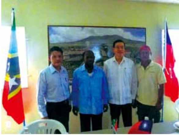
●立下汗馬功勞後身退前合影留念：由左至右為承建溫室之名澄公司董事長楊賓棟、克國道格拉斯總理、駐館曹大使立傑及小高。