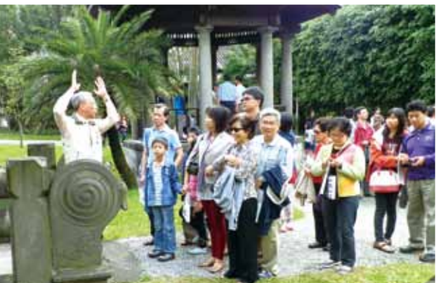
●臺北賓館的志工熱心導覽。