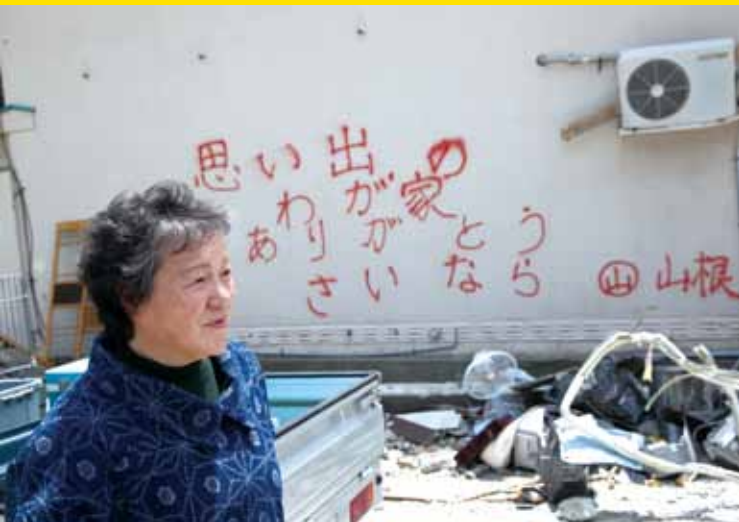
●東日本地震導致民眾房子倒塌，災民在房子決定拆毀前以紅字寫下「充滿回憶的家，謝謝你，再見」，表達對家園的不捨。

我匆匆下車，冷風颼颼，大雪飄落滿身，好像聞到核輻射的味道，下意識拉緊套頭帽，快速跑進加油站便利商店，幸好有在營業，買了一些熱包子、礦泉水及乾糧，分送車隊一行，司機回送我一個冷飯團。