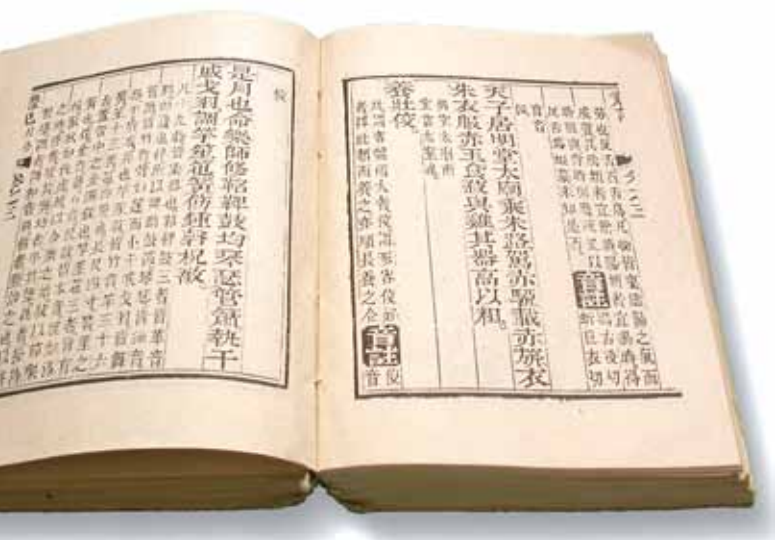
●五經中有「禮記」。古時官制，中央政府設六部，「禮部」居其一。

邀至中央各部會，如國安局、法務部司法官訓練所、經濟部、財政部、陸委會、勞委會、國家文官學院、或由外交部外交學院委外辦理的外交研習營及其他民間機構演講「國際禮節」課程。出乎我預料之外的是，絕大多數的邀請單位都指明要我去演講「國際禮儀」而不是「國際禮節」。以至於在每次演講時我都要先聲明自己並沒走錯教室，同時要講的題目是「國際禮節」，請大家多多包涵，接著再將禮貌、禮儀與禮節之差別加以說明，倒是費了一番功夫。個人以為，就典禮儀節而言，每位參加典禮者都處於「被動的」方式，整個典禮完全由司儀一人來掌控；若將其視為典禮的「靈魂人物」，一點也不誇張。全場中他或她權力最大，都由他們在「發號司令」，要我們站就站、坐就坐，一切都得聽從指揮。事實上，「禮儀」跟我們的日常生活完全無關，它只是依附在典禮之上，沒有了「典禮」，自然就沒有「儀節」單獨存在的意義，唯有在舉行典禮時它才會被派用上場；同樣道理，沒有「儀節（式）」，