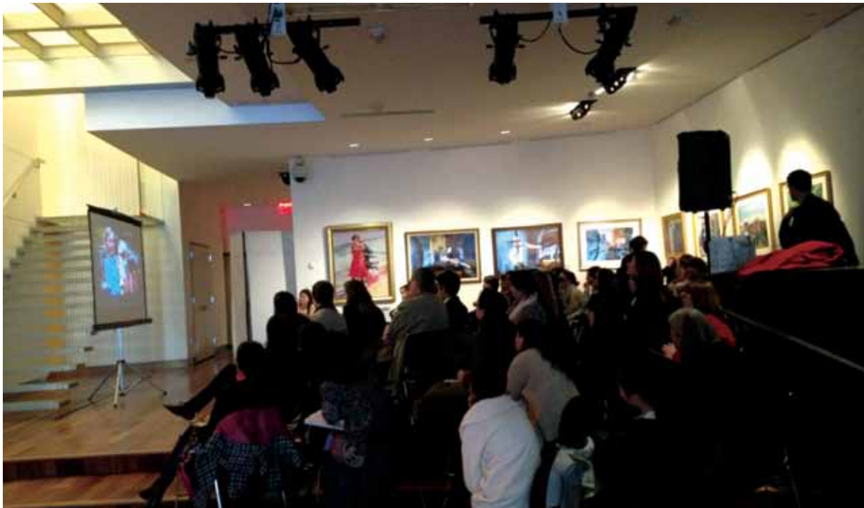
●影片「It's a Girl」於駐紐約臺北經濟文化辦事處播放時高朋滿座。