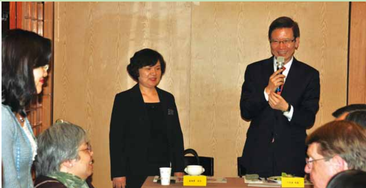
●韓國駐華丁代表相基（右一）偕同仁向大家致意。

人靈命上均遭遇磨練與挑戰。回國後，我祈求神重新恢復（restore）我與祂之間的親近關係，也祈求神原諒及寬恕個人的諸多缺失與不是。本人曾在靜默黑暗中向神承諾、呼求，要在有生之年繼續作神的器皿，把個人的喜怒哀樂擺下，把個人的計畫及名位擱置一旁，完全照著神的意旨而行。也確實非常感恩，有很多事情在最後一秒的緊要關頭，神都照著祂的應許以及我們所祈求的來成全，讓我重新看見俗世的空幻。