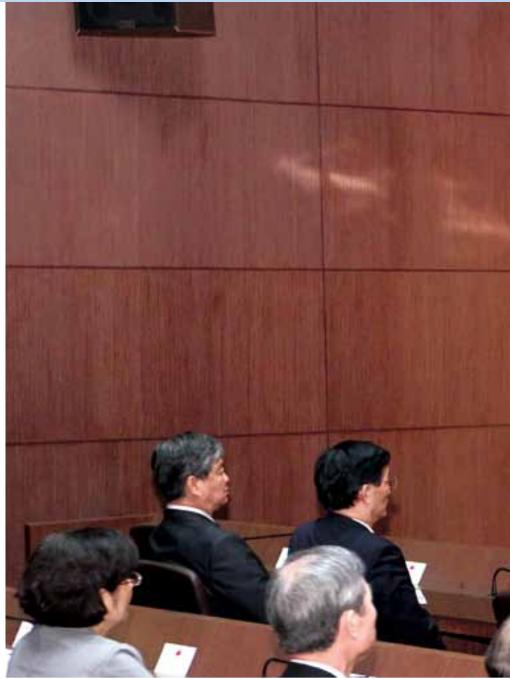
●馬總統於開訓典禮上致詞。

近兩年與中國大陸談的服務貿易協定，近期就會有結果，將來在貨品貿易部分仍需借重人才，同樣的，談的內容不一定限於國際，亦可能是兩岸或其他事項，牽涉到的不只有經濟部，也包含外交部及其他部會，業務的內容具有多樣性，因此我特別想提出幾點與大家共勉：