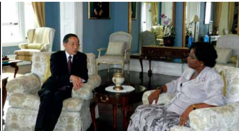
●林部長晉見聖露西亞露惹絲（Dame Pearlette Louisy）總督。