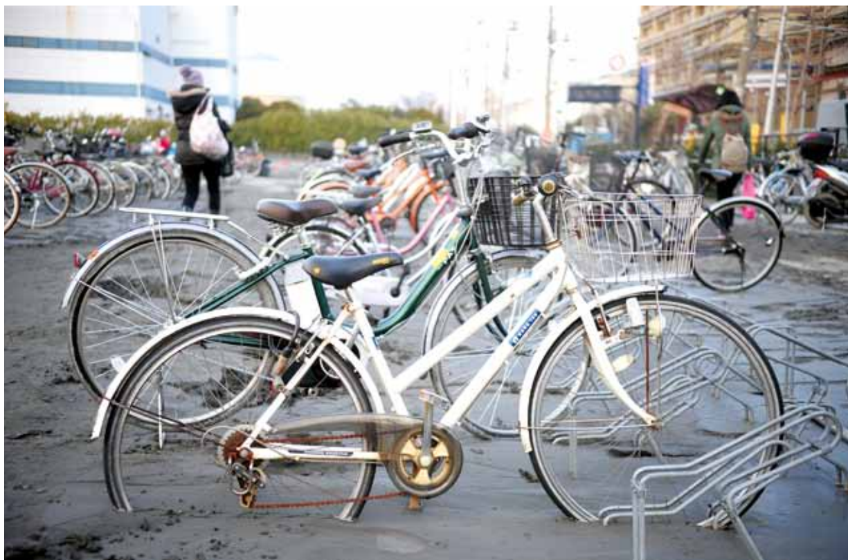
●東日本大地震後，東京地區發生土壤液化災情，停車場裡的腳踏車遭湧出的泥沙淹沒了部分車體。

隔天上班，有同仁訴說昨晚花 3 小時走路回家，亦有同仁表示，因電車不開，離家又遠，昨晚乾脆就在辦公室過夜。餘震整天晃個不停，電視全部是震災新聞，娛樂節目均暫停，大家下班回家幾乎都盯著電視。此