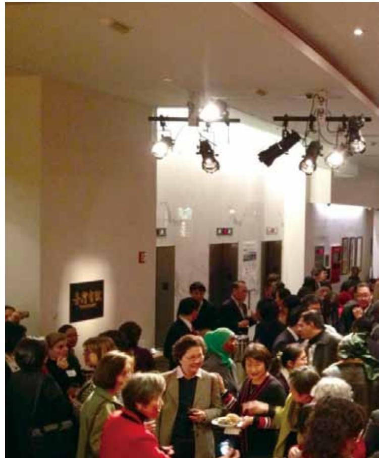
●慶祝國際婦女節暨歡迎臺灣

聯合國自 1946 年成立 CSW，作為專責處理婦女權利議題最高層級委員會以來，不斷努力將婦權議題提升至全球重要議程。除於 1979 年通過「消除對婦女一切形式歧視公約」(Convention for the Elimination of All Forms of Discrimination against Women, 以下簡稱 CEDAW)，作為聯合國五大人權公