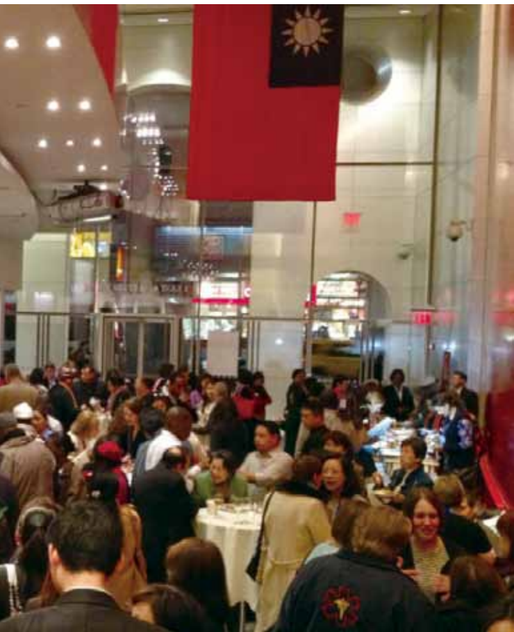
婦女代表團晚會現場熱鬧非凡。