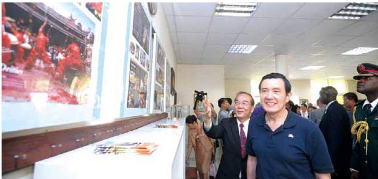
●馬總統於 2012 年 4 月訪問甘比亞時，巡視臺灣文化中心。

其學打中國結藝，於是本人請內人協助儘快成立「中國結及紙藝班」。此一藝術當年在臺灣夯紅，之後其藝品大量充斥市場，價格太便宜了以致無人想學，但內人在隨我赴任的歐、亞、非、大洋洲各個任所，甚至在外交部之同仁眷屬當中，均可藉此手藝廣交朋友，參與國際婦女會社團，擔任教學，弘揚文化，無不受歡迎，而且長年教學相長，也能自行加上許多創意。