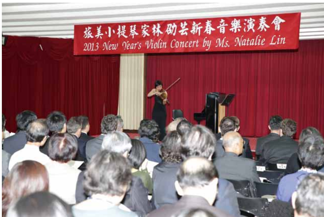
●觀眾聚精會神聆聽音樂演出。