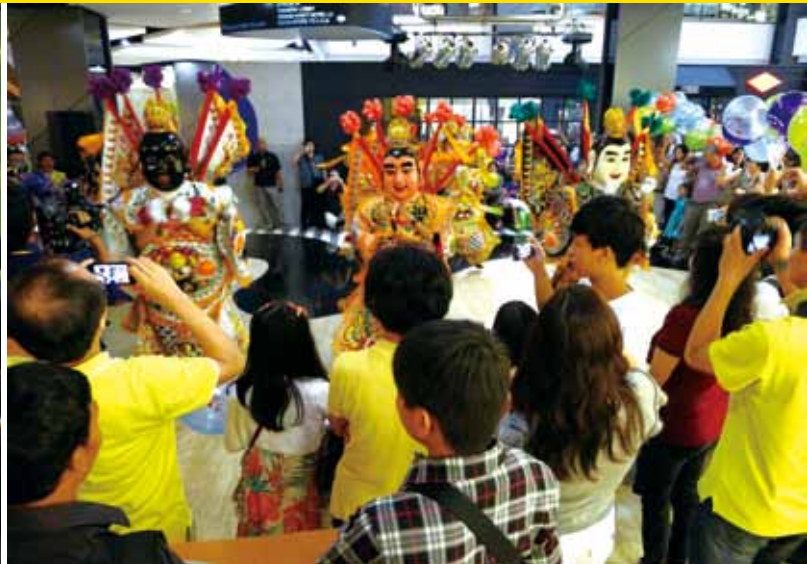
●台南新營電音三太子在 Plaza Indonesia Mall 首演時的盛況。

天兵天將，民間奉為神明，敬稱太子爺，信眾視他為驅邪制煞的守護神，再加上神話小說「封神榜」的活靈活現，造型原屬特異（身披混天綾飛帶與紅肚兜，腳踏風火輪），如今臺灣學子稍加逗趣改造，墨鏡奶嘴全上身，不啻顛覆了傳統神偶的刻板印象，難怪所到之處，無不造成萬人空巷的盛況。