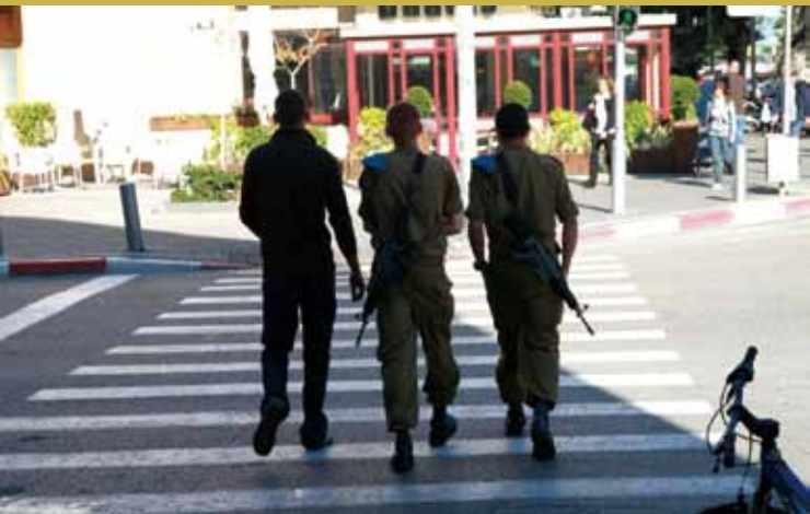
●街頭持槍的阿兵哥。

以色列的創新不僅在 IT 產業，在生醫、生技、製藥、化學（有 3 位諾貝爾化學獎得主，去年均曾在本處安排下赴臺訪問），均有獨到的利基產品；即使是農業科研成就也十分可觀，如其滴灌技術，嘉惠缺水國家，在以國更是變沙漠為良田，種出美味的香蕉、椰棗，各種蔬果、生菜、青紅椒、柑橘等暢銷歐洲。沙漠中進行養殖漁業，成就亦頗傲人。