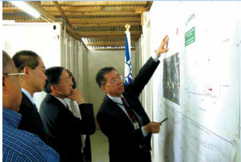
●林部長視察海外工程公司執行雙邊合作計畫「Mais Gâté 大道延伸路段工程」進度。

館團及合作計畫同仁、參觀 St. Paul's 紀念公園及 Brimstone Fortress 國家公園等。