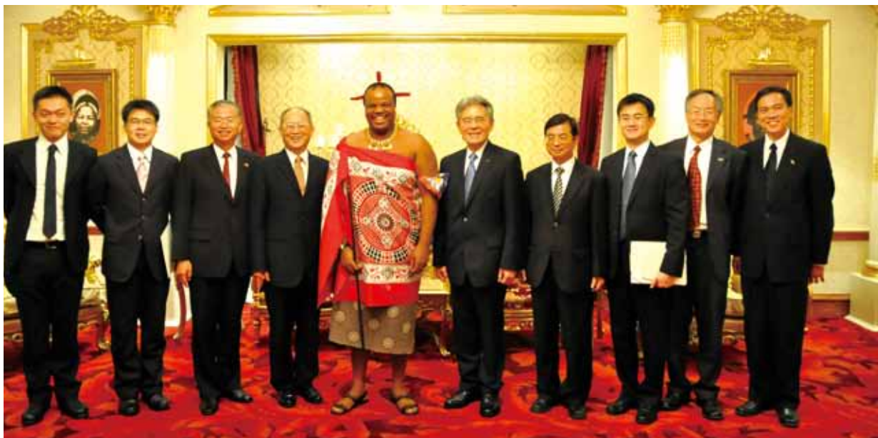
●史國國王接見我國訪團後合影。