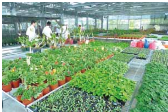
●溫室內植栽花卉滿堂。