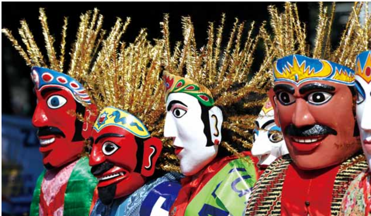
●這幾尊是印尼雅加達市的護市神偶，每逢六月首都市慶時，市民將神偶搬到大樓前或重要街口，添加節慶喜氣。