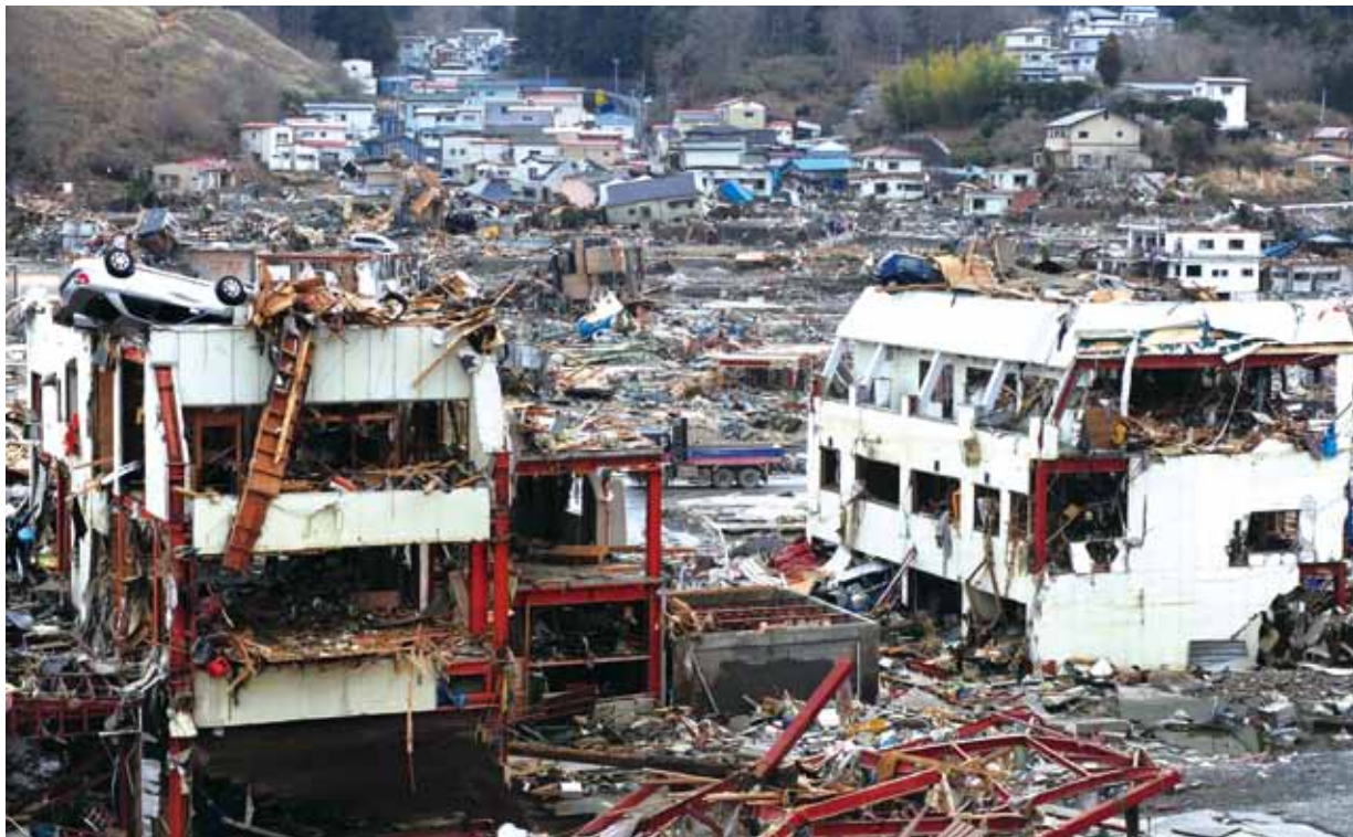
●日本宮城縣女川町震後一片蕭條景象。

下班一踏進家門，兩小孩迫不及待的述說地震當時，他們是如何慌張，無處逃避，以及家中碗盤墜落滿地的狼狽情形。我說有接到媽媽手機報平安，她搭電車一出銀座站正好遇到地震，就近在一家百貨公司避難，被禁止外出，不知何時可回家。打開電視，災情陸續傳出，東京一棟大樓倒塌，千葉市