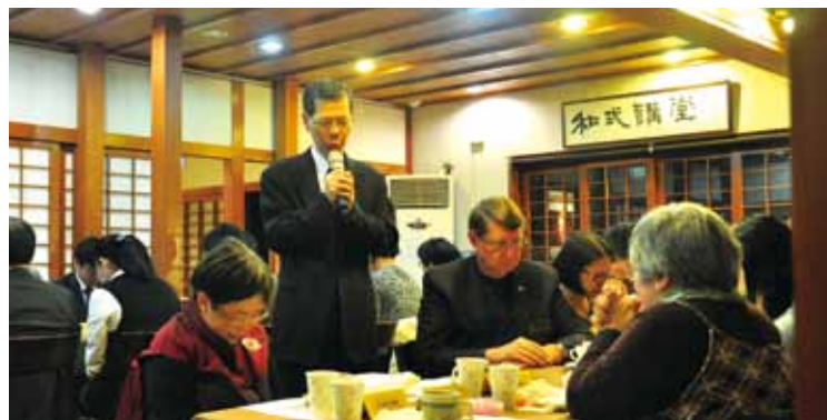
●福音社社員低頭禱告，感謝主恩。

最後，謹祝福在座的各位都能蒙神保守、平安康健。也求神繼續賜下祂的慈愛與恩典給我們，保守各位前面的道路通達平坦，滿有祂的榮光照耀！謝謝！