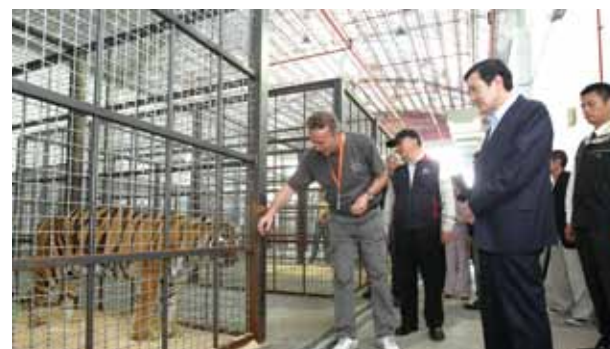
●馬總統於「少年Pi的奇幻漂流」在臺中水湳機場拍攝期間曾前往探視李安及工作團隊。