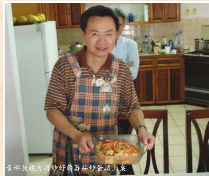
黃部長親自將炒好的蕃茄炒蛋端上桌

2007年4月30日，當黃部長與聖露西亞外交部長布斯吉簽署台聖復交聯合公報，並發表談話公開讚許聖國總理康普頓爵士閣下時，屋子裡的人幾乎不敢相信自己做到了，影片裡晃動的人影記錄著當時激動的心情。那麼，有人記得那個許下的承諾嗎？如果忘了就算了，畢竟部長的行程那麼緊湊，下午還有大使館的揭