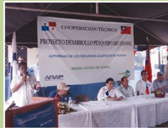
巴拿馬總統感謝台灣輔導第15個漁產品集貨場落成

(註：本篇為前駐德國代表處謝代表志偉於96年4月25日邀德國政要、學者及媒體記者與台北聯連線舉行「陳總統視訊會議」後所撰)