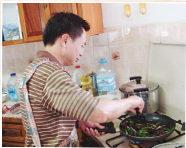
黃部長細心翻炒台灣帶去的臘肉，廚藝加上菜的配色有專業水準

2007年5月1日上午11點多，一輛疾駛的黑色轎車加速開上我國友邦聖露西亞Bella Rosa的小山坡，山坡上民房裡的幾個人一陣緊張，「這裡不是很隱密嗎？」「難道事情有變？昨天的喜悅只是曇花一現？」思緒還沒結束，黑色轎車已然開進了民房。本以為4個多月的時間可以讓身體習慣炎熱，但尖銳