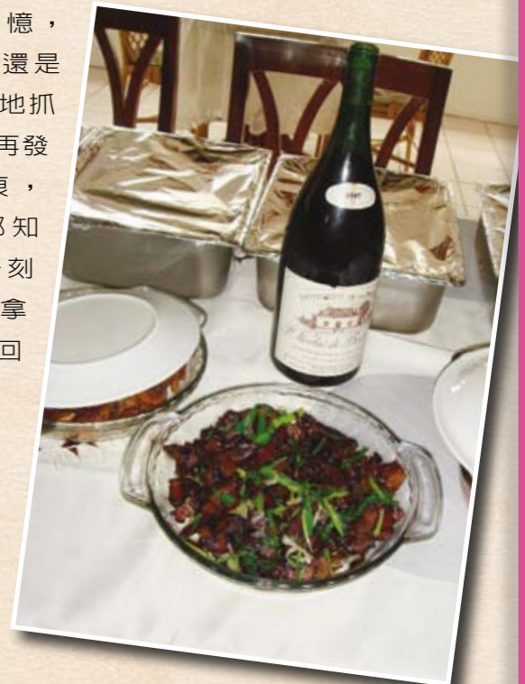
部長下廚料理的炒臘肉搭配1997年份紅酒相得益彰

建交後的慶功宴，不選在五星級飯店裡，而是在這個待了4個多月的家，由我們的大家長親自下廚犒賞大家，場景雖有點另類，但別具意義！多年以後，或許今天菜色會被淡忘，或許有些人的名字不復記憶，或許有人還是會不自覺地抓著已經不再發癢的咬痕，但大家都知道，這一刻將不時被拿出來咀嚼回味。