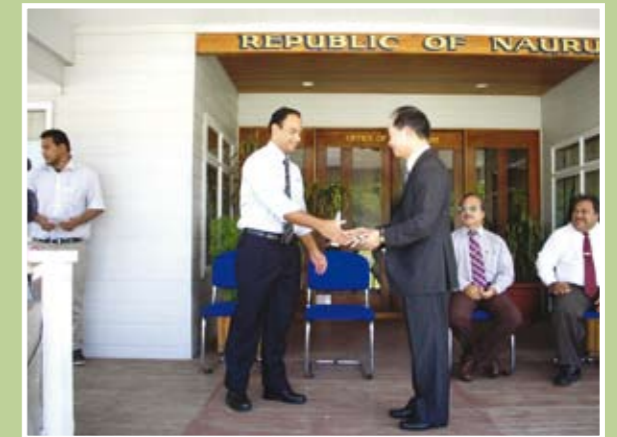
我贈送諾魯電力公司三輛工程車捐贈儀式，由負責中央公用事業(Central Utilities)之亞定(David Adeang)外長代表接受，諾魯總統史可迪(Ludwig Scotty)及教育部長Baron Waqa等在場觀禮。