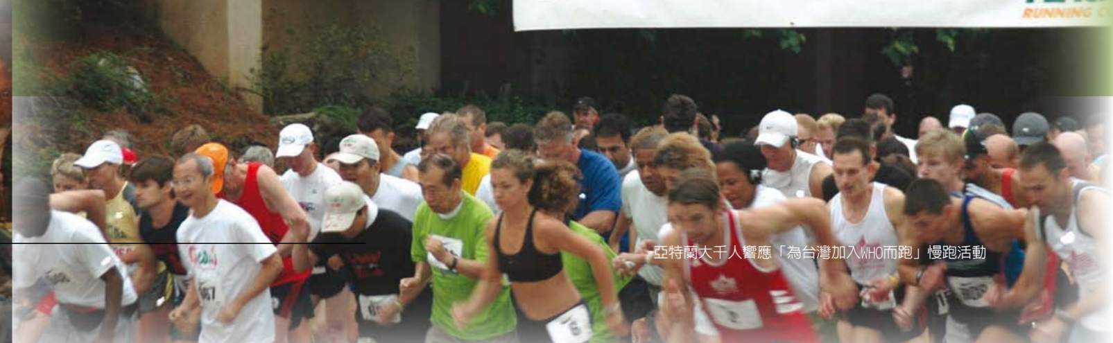
亞特蘭大千人響應「為台灣加入WHO而跑」慢跑活動