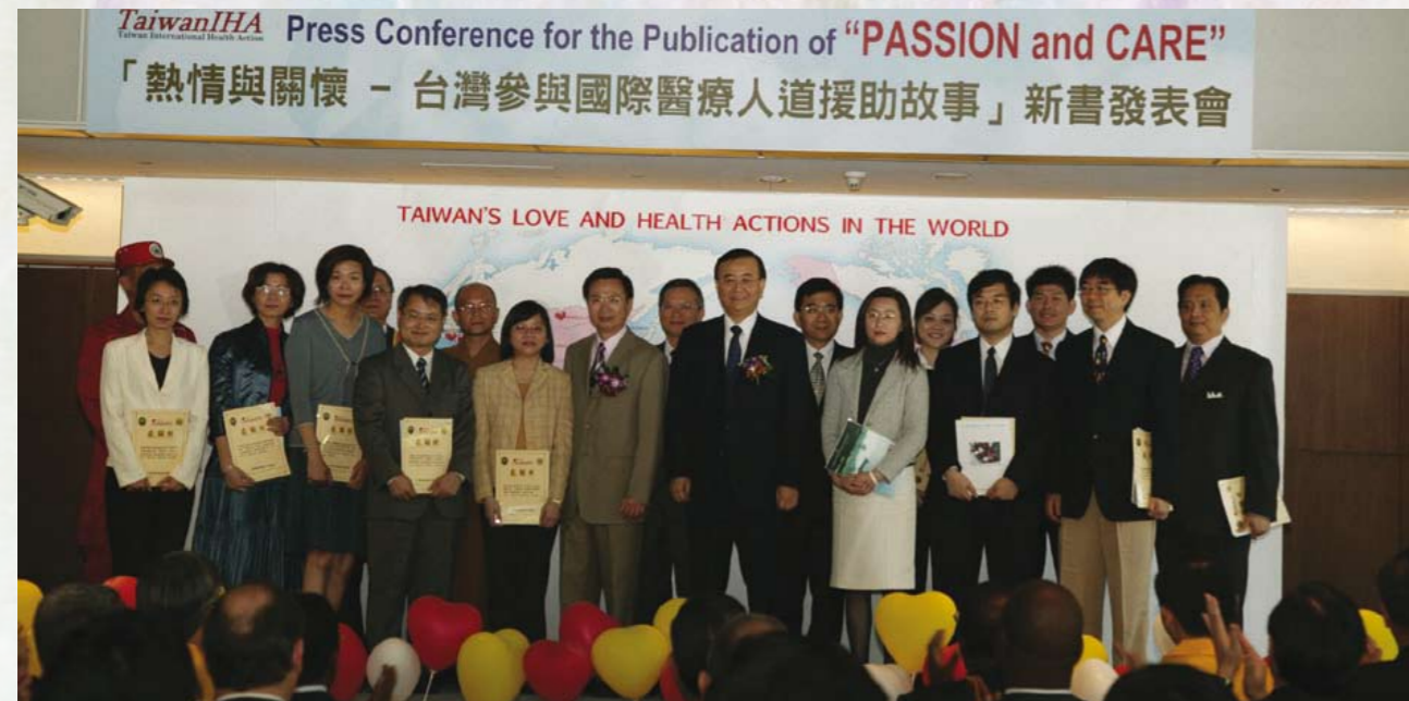
黃部長與侯署長與提供圖片之公益團體代表合影