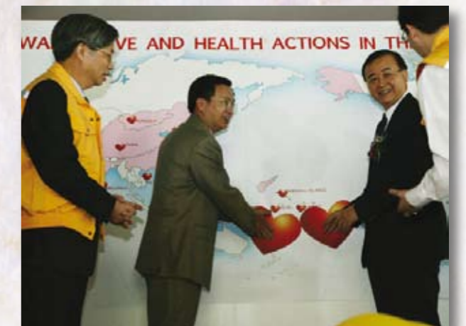
每顆愛心都代表曾經接受台灣醫療援助的國家

未來「熱情與關懷」將有續版計畫，歡迎所有駐外館處踴躍提供相關圖片，讓台灣醫療援外的足跡，永遠留存。