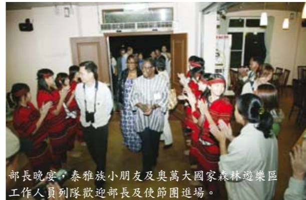
部長晚宴，泰雅族小朋友及奧萬大國家森林遊樂區工作人員列隊歡迎部長及使節團進場。

Powerpoint簡介Ecotourism之現況，以及未來我們與友邦可進行合作的方向。在座的大使伉儷們，雖然已略感疲憊，仍聚精會神聆聽。其中聽到最令人興奮的資訊，是台灣「特有鳥」的恢復生機。台灣在80年代末期，曾被全球環保團體嚴重批評為破壞環境與生態者，就以鳥類而言，台灣的帝雉(Mikado Pheasant)、藍腹鶇(Swinhoe's Pheasant)和黃山雀(Yellow Taiwan Tit)，都曾被列入全球用來評估成千上萬物種和亞種是否有瀕臨滅絕危機的「國際自然保護聯盟紅皮書」(the International Union for Conservation of Nature Resources Red List)，也就是說上述的鳥種曾屬於「瀕臨絕種」之鳥！後來政府通過「野生動物保護法」(於1989年通過)，並在1984年至1995年間成立六處國家公園，而民間團體也呼籲大眾致力生態保育，種種努力使這三類鳥種，終於在1998年從紅皮書中除名，也就是不再「瀕臨絕種」了。此舉也使全球的賞鳥人士無不對台灣鼓掌喝采並肅然起敬。對於我們外交人員而言，這可是最佳的文宣，值得向國際環保人士宣揚。