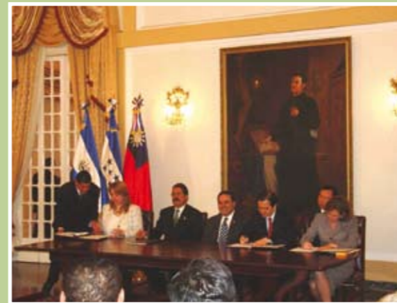
台薩宏簽署自由貿易協定