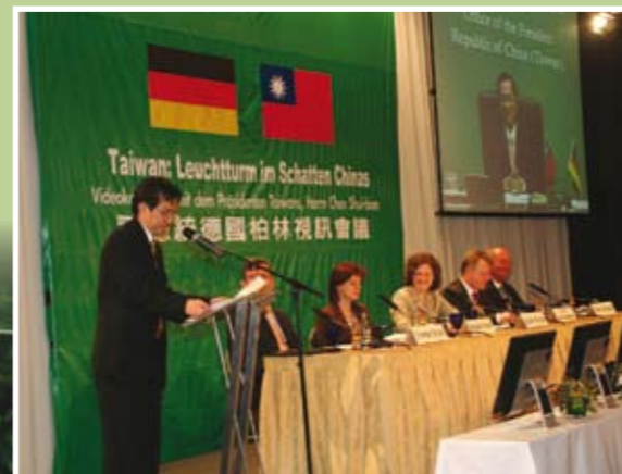
駐德國代表處舉辦「陳總統視訊會議」暨「台灣：中國陰影下的燈塔」研討會