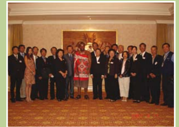
史瓦濟蘭國王接見南非地區台商投資考察團