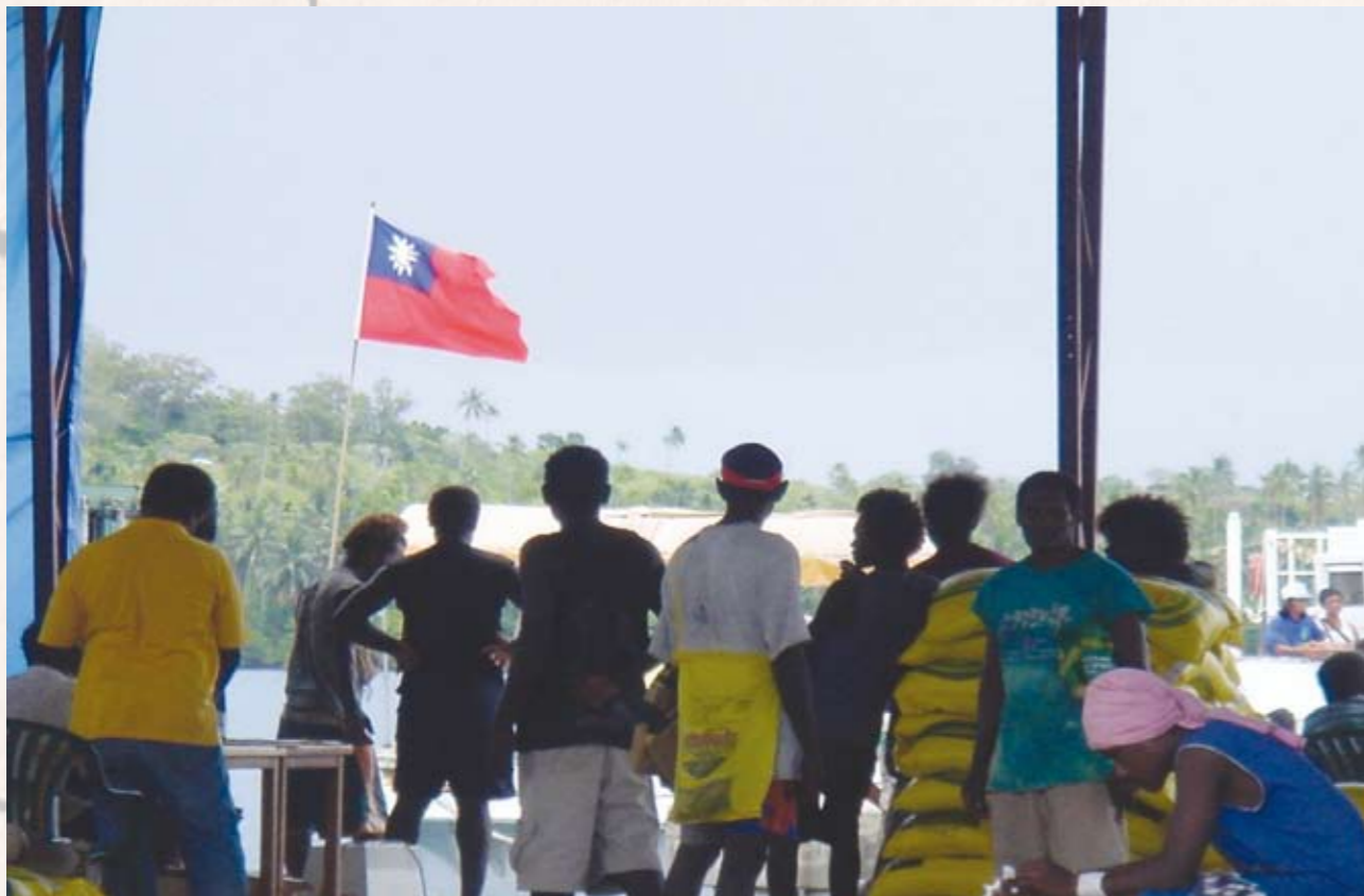
台灣國旗飄揚在GIZO島