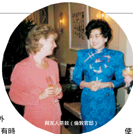
與友人茶敘（倫敦官邸）

忙碌的生活需要適度調劑。夫人透露，部長維持充沛體力的方式是固定運動和清淡飲食，他每星期都會抽出一點時間騎馬或游泳，在食物的方面，部長大都吃魚和素菜。夫人自幼學習鋼琴，喜歡音樂和閱讀，這也是部長的