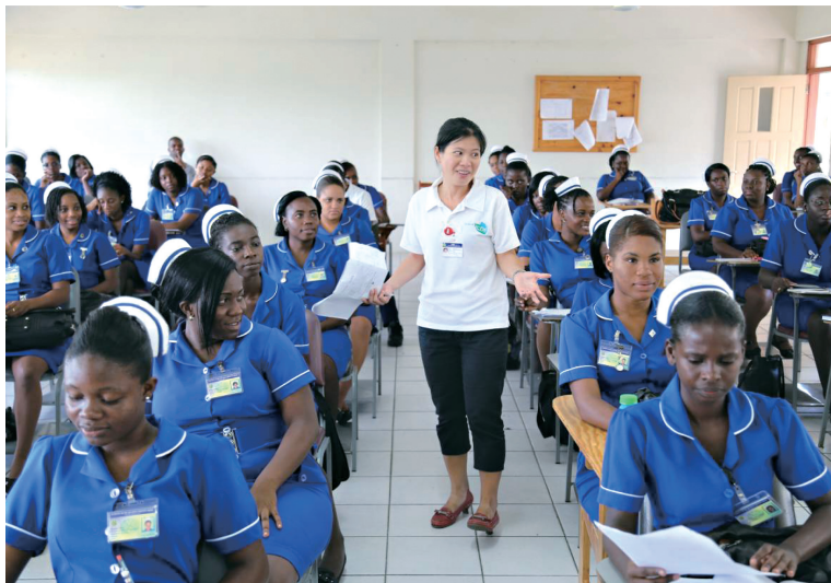
財團法人國際合作發展基金會派駐聖文森醫護志工在聖文森護士學校進行教學工作