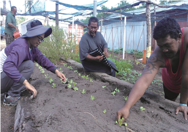
諾魯外交替代役園藝役男督導當地工人種植葉萵苣