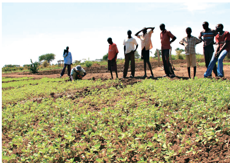
「南蘇丹阿比耶地區難民糧食安全支援計畫」為瞭解當地農作種類與方法，前往當地農田進行田野調查