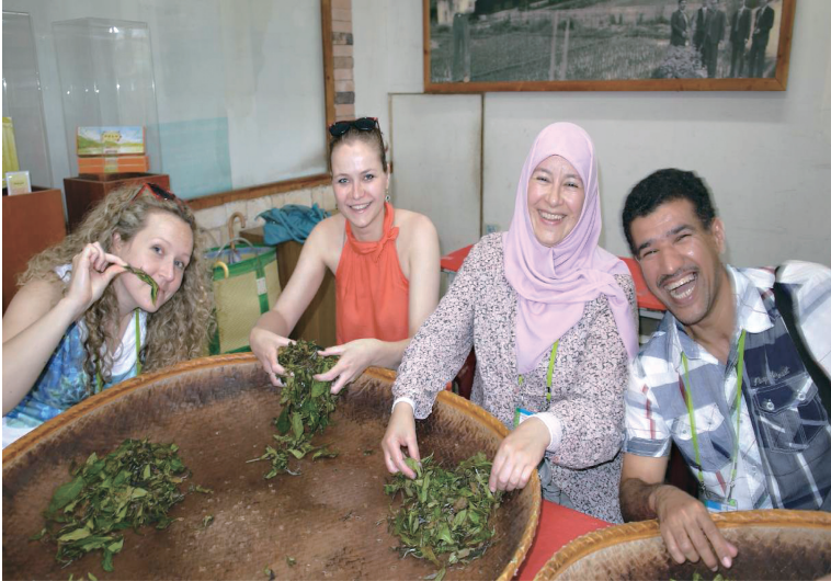
製茶樂--102年度辦理之一鄉鎮一特產(OTOP)計畫推廣研習班學員於南投縣魚池鄉製茶廠之體驗