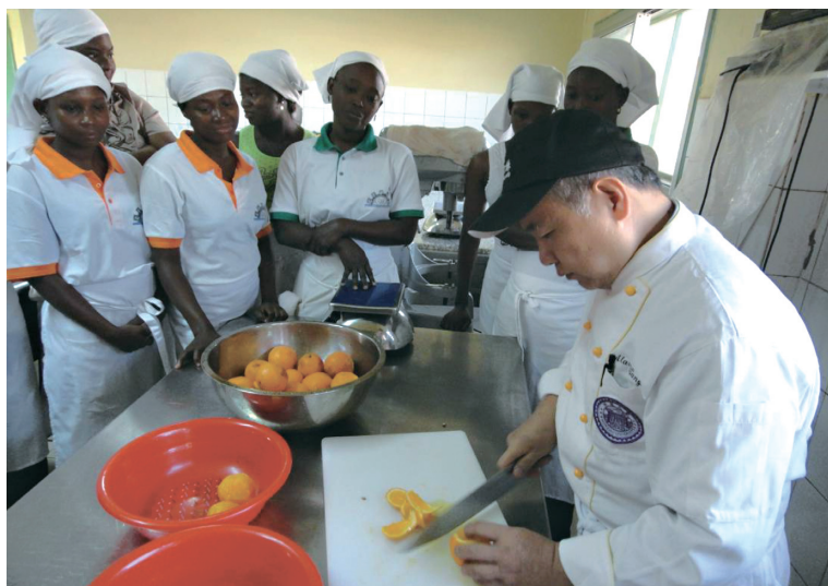
布吉納法索職訓計畫烘焙講師向學員講授課程