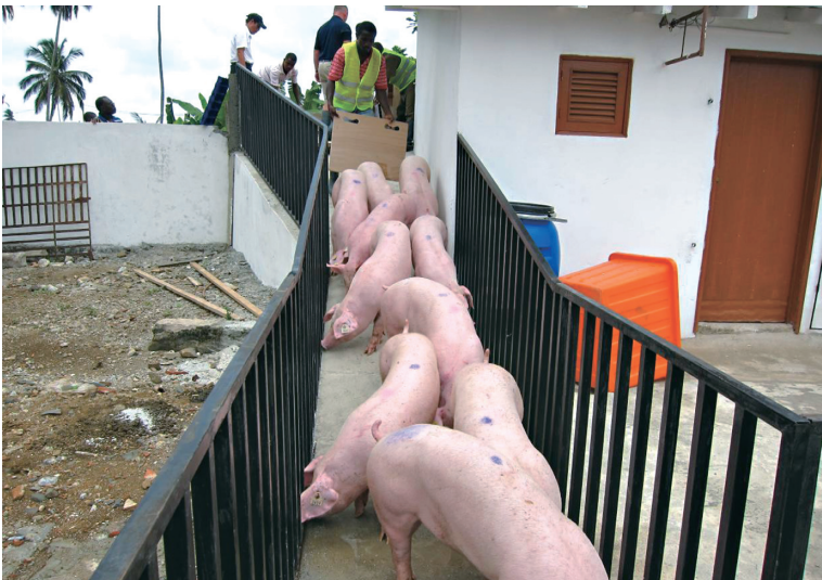
聖多美普林西比養豬發展計畫自英國進口的新種豬