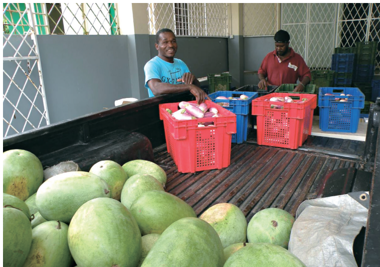
駐聖露西亞技術團果蔬計畫在第六推廣區輔導產銷班農民產品銷售