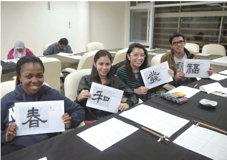
財團法人國際合作發展基金會「國際高等人力培訓外籍生獎學金計畫」就讀於國立清華大學受獎生學習毛筆體驗中華文化