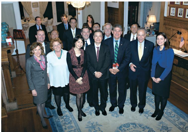
駐美國代表金溥聰夫婦（前排右4、右5）於雙橡園宴請美國聯邦參議員曼欽（Joe MANCHIN）（前排右3）等政要（2月27日）