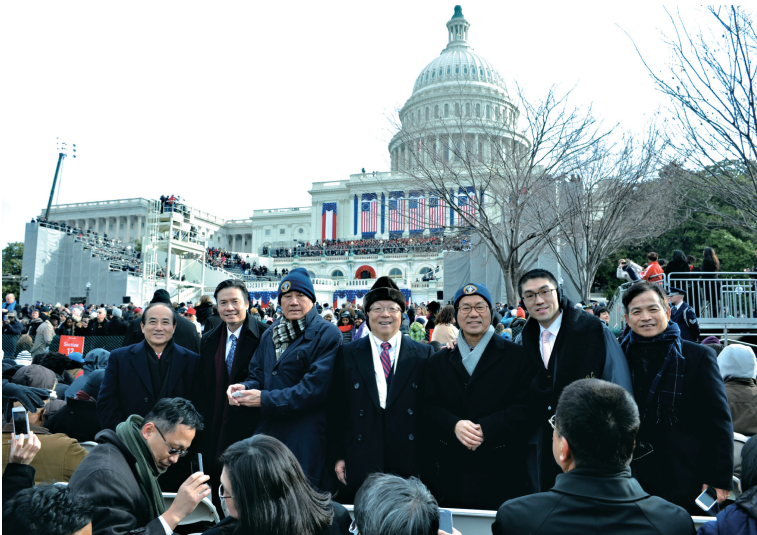
立法院院長王金平率領我國代表團出席「第57屆美國總統就職典禮」(1月20日)