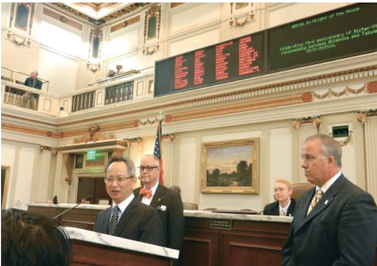
駐休士頓處長夏季昌應邀訪問奧克拉荷馬州眾議會，致詞時感謝美國及奧州長期對我國之支持（4月10日）