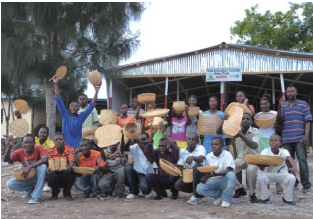
國合會配合外交部海地地震災後重建計畫，持續推動災民「職業訓練與就業輔導計畫」，透過竹家具及竹編織訓練班，輔導受益戶習得製作簡易竹家具及手工藝品之技能，以賺取副業收入。