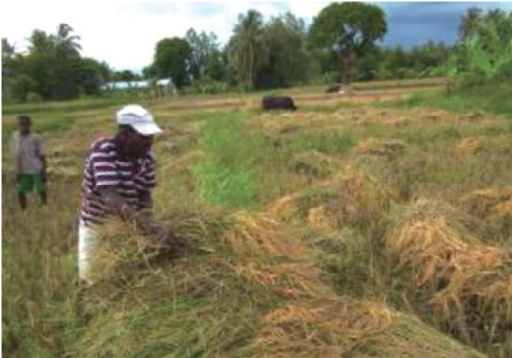
透過「海地多爾貝克稻米生產及行銷計畫」，國合會提升該地區水稻生產技術與產能，在我駐海地技術團協助下，Chalette推廣區農民稻作豐收。