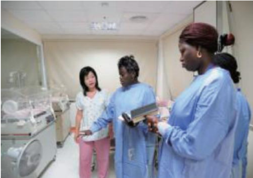
國合會「友好國家醫事人員訓練計畫」之代訓單位之一——輔英科技大學助產系提供布吉納法索助產士學員訓練課程。