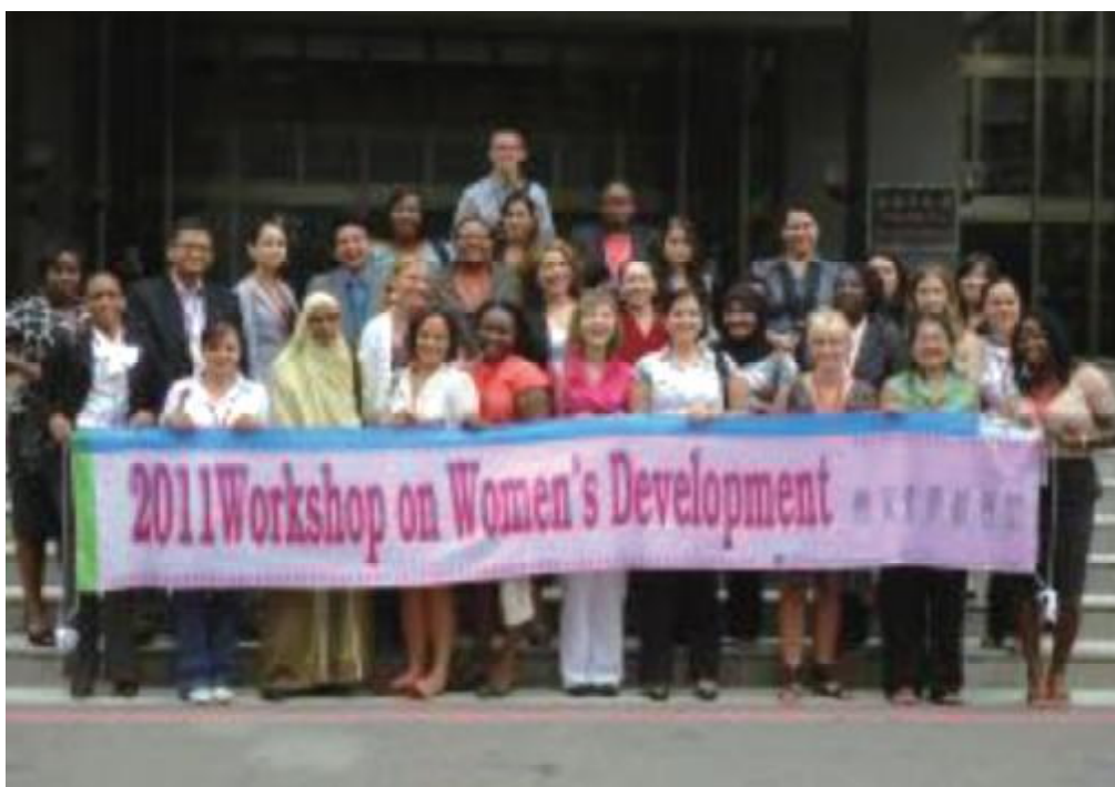
國合會100年「婦女發展研習班」安排28名來自友邦及友好國家之學員拜會高雄市市政府。