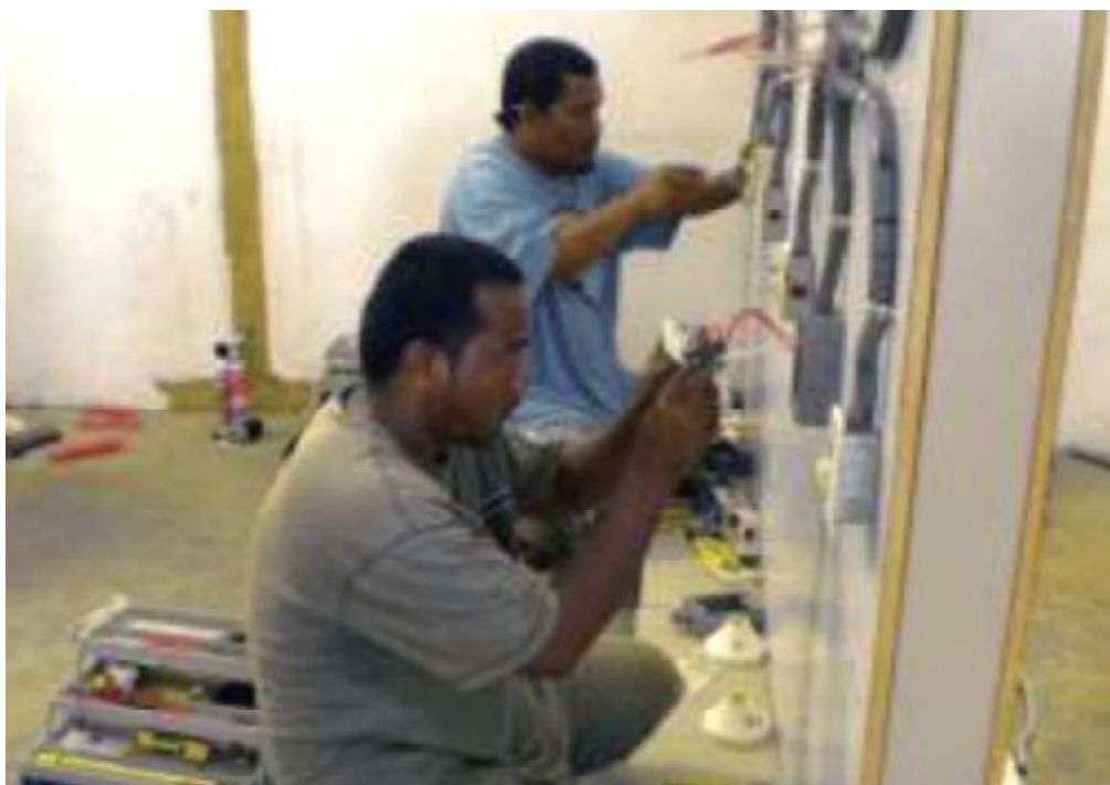
國合會「馬紹爾技能訓練計畫」之「水電修護與配管」訓練專班教導參訓學員相關專業技能。