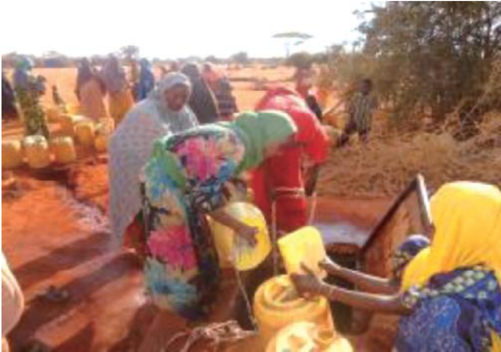
國合會與美慈組織（Mercy Corps）合作在肯亞進行旱災援助計畫，其中包含恢復當地供水系統，婦女可至供水站取得清潔安全的飲水。